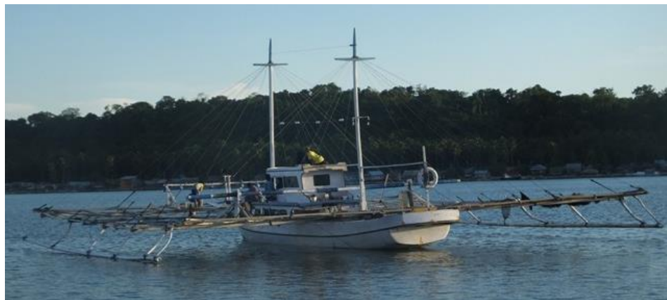
Gambar 1. Bagan Perahu

Bagan perahu biasa dioperasikan menjelang malam hingga pagi. Pengoperasiannya dimulai dengan penurunan jangkar untuk memastikan kapal tidak terbawa arus. Kemudian lampu neon diletakkan pada bambu penyanggah lampu dengan jarak antara lampu dan kapal motor 3-4 m. Ketinggian lampu terhadap permukaan air 1,5 m. Lampu dipindahkan ke lambung kanan kapal sehingga ikan yang terkumpul tidak menyebar. Setelah perairan mulai tenang waring diturunkan dengan memasang bingkai pada bagian atas kantong dan kondisi lampu tetap terang. Penurunan waring dilakukan perlahan kemudian dibiarkan selama 3 jam sampai diperkirakan ikan sudah terlihat banyak lalu diangkat. Penarikan waring dilakukan oleh nelayan secara perlahan dan bersamaan dengan penguluran tali jangkar oleh anak buah kapal agar kapal perlahan mundur serta ikan tetap pada area penangkapan. Waring diangkat hingga mencapai permukaan perairan. Setelah bingkai waring mencapai permukaan, badan jaring ditarik dan ikan yang berada di kantong waring diambil dengan menggunakan serokan.