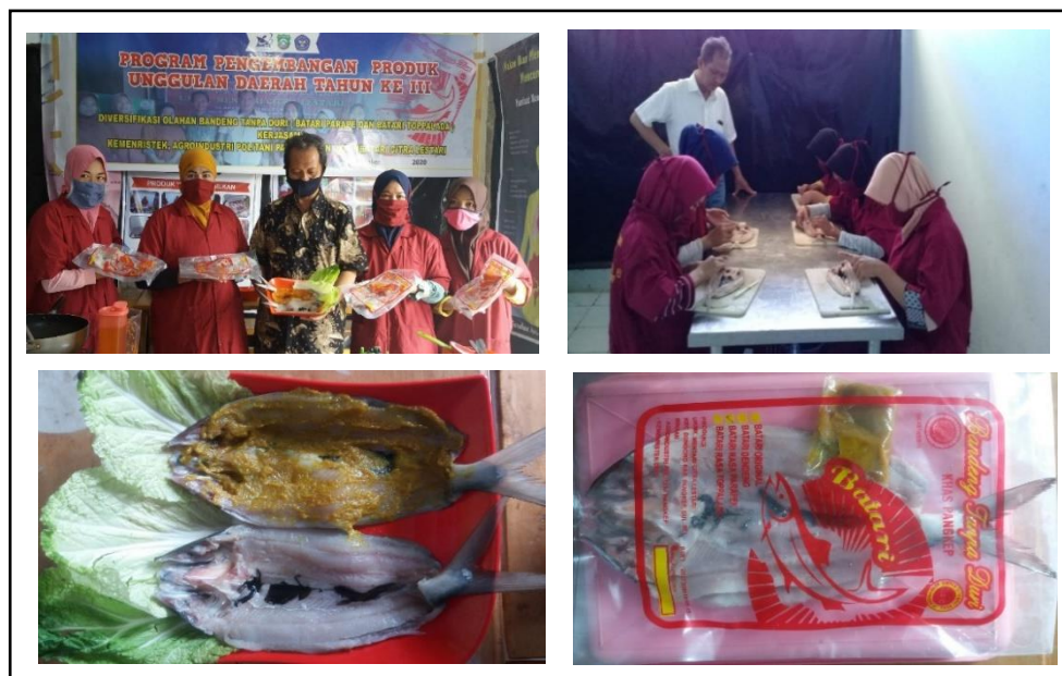
Gambar 3. Pelatihan pembuatan bandeng tanpa duri rasa parape di UKM Mentari Citra Lestari dan Tim PPUD.