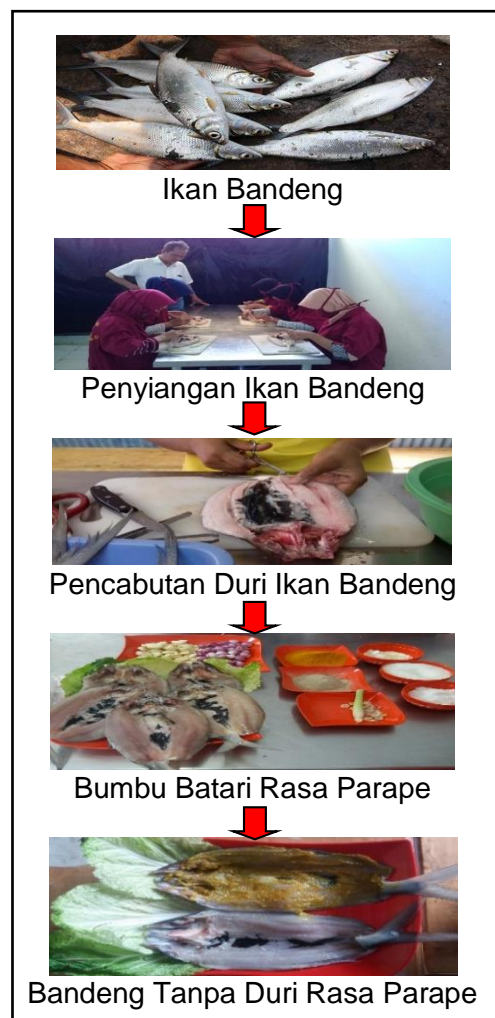
Gambar 2. Skema Alur Proses Bandeng Tanpa Duri Rasa Parape.