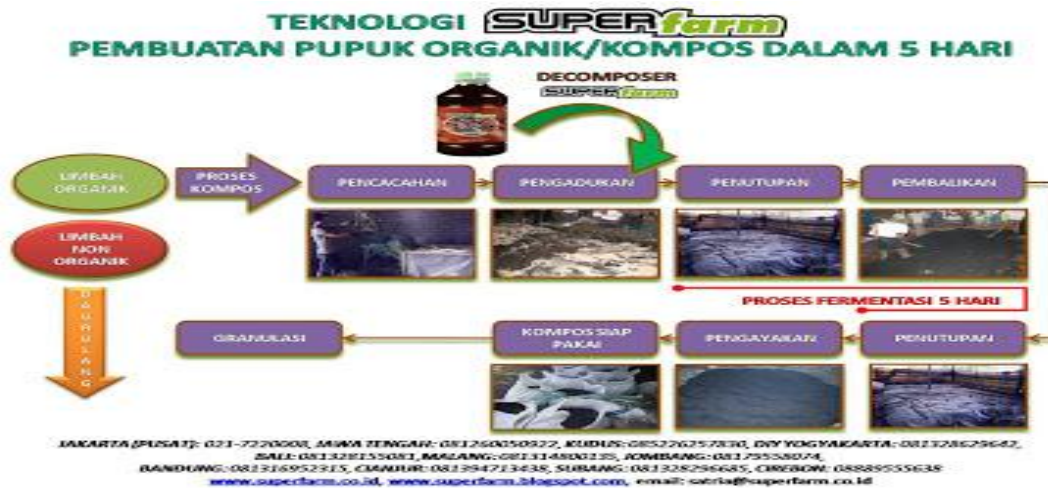
Gambar 1. Teknologi Super farm

mikroorganisme lokal sebagai dekomposer. Teknologi super farm , dilaksanakan seperti cara di bawah ini (Gambar 1).