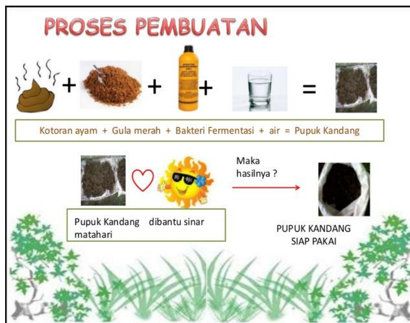
Gambar 2. Pembuatan kompos dari kotoran unggas/sapi menggunakan EM4 dan Mikroorganisme Lokal

Pembuatan kompos dari kotoran dan mikroorganisme lokal dengan cara unggas/sapi juga dilakukan dengan EM4 seperti di bawah ini (Gambar 2).