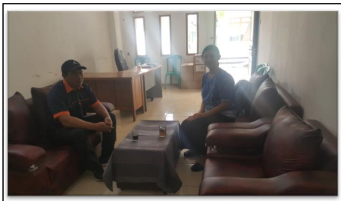
Gambar 2. Konsultasi Pengembangan BUMDes Wahana Bakti.