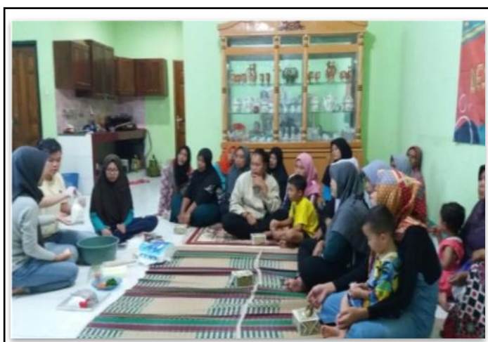
Gambar 3. Penyuluhan produk kepada masyarakat.

Program kerja yang dilakukan untuk mengenalkan inovasi produk Mahasiswa KKN pada warga Desa Mekarbakti adalah penyuluhan produk yang dilanjutkan dengan demonstrasi masak (Gambar 3). Adapun materi yang dipaparkan meliputi penjelasan produk, kelebihan produk, kemasan produk, biaya produksi, harga jual untuk tes pasar, dan kegiatan pemasaran produk. Warga desa selanjutnya diajak untuk mengikuti demonstrasi masak bersama Mahasiswa KKN.