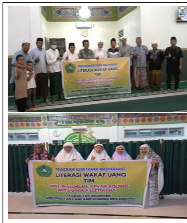
Gambar 4. Foto bersama dengan masyarakat.

selesai sebanyak 17 orang serta mengisi absensi kehadiran. Ini juga tidak lepas atas arahan dari pemateri, agar lebih efektifnya tingkat sasaran yang akan diberikan pada PKM Literasi Wakaf Uang ini. Namun pada kenyataan dengan yang lebih target yang di inginkan, artinya disini adanya kaingintahuan dari masyarakat lainnya dalam literasi wakaf uang ini sebanyak sepuluh (17) masyarakat (Gambar 4).