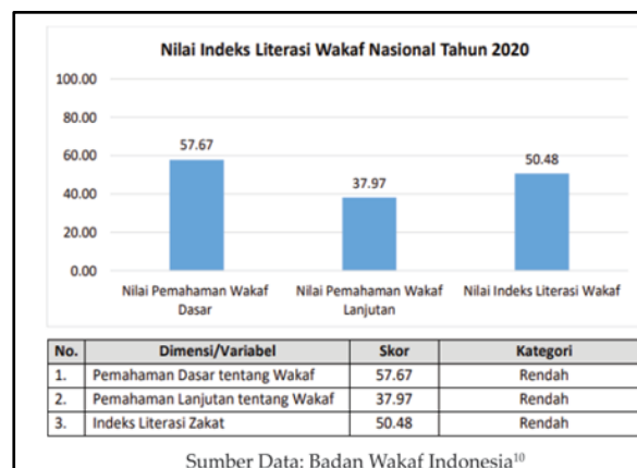
Gambar 1. Indeks Literasi Wakaf Nasional 2020.

Mubarok (2021) menyatakan bahwa secara nasional dapat dilihat pada gambar berikut rendahnya pengetahuan/kesadaran masyarakat akan wakaf uang (Gambar 1).