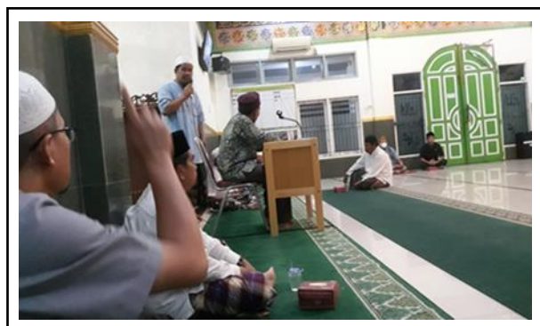
Gambar 2. Dokumentasi pelaksanaan penyuluhan di masjid.