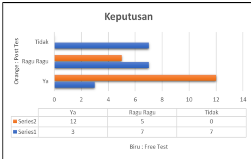
Gambar 7. Keputusan akan literasi wakaf uang.

Keputusan inilah yang akan menjawab dari sebuah kesimpulan dari pelaksanaan pengabdian ini. Literasi wakaf uang ini akan menjadi potensi yang menjanjikan bila keputusan akan wakaf uang ini bias di terima semua kalangan khususnya kalangan secara ekonomi, ekonomi menengah ke atas.