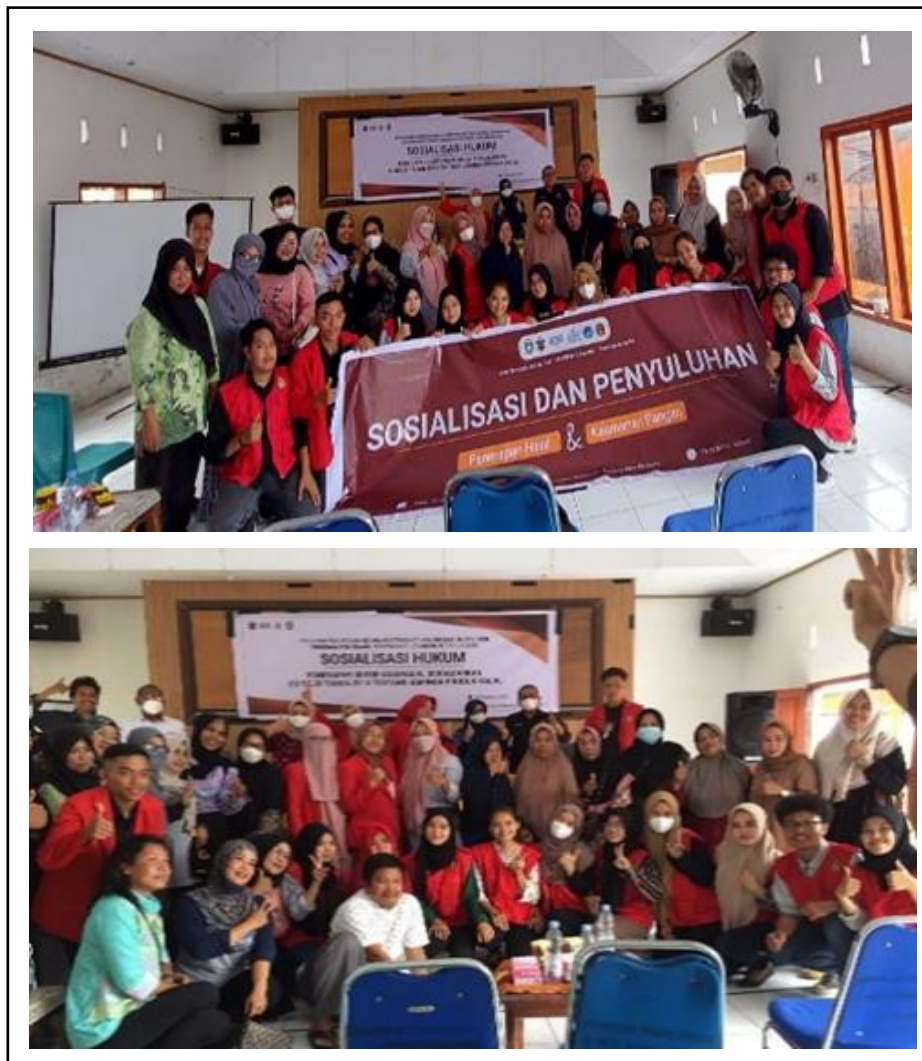
Gambar 6. Sosialisasi Penerapan Halal, Hukum, Penyelia dan Penyuluhan Keamanan Pangan.

Pelaksanaan sosialisasi penerapan halal, sosialisasi penyelia, sosialisasi hukum sertifikasi halal dan penyuluhan keamanan pangan dilaksanakan secara Bersama. Kegiatan dilakukan bersamaan untuk efektivitas waktu. Kegiatan dilaksanakan di Aula Kecamatan Soreang dengan mendatangkan narasumber dengan bidang keahlian masing-masing. Kegiatan sosialisasi dapat dilihat pada Gambar 6.