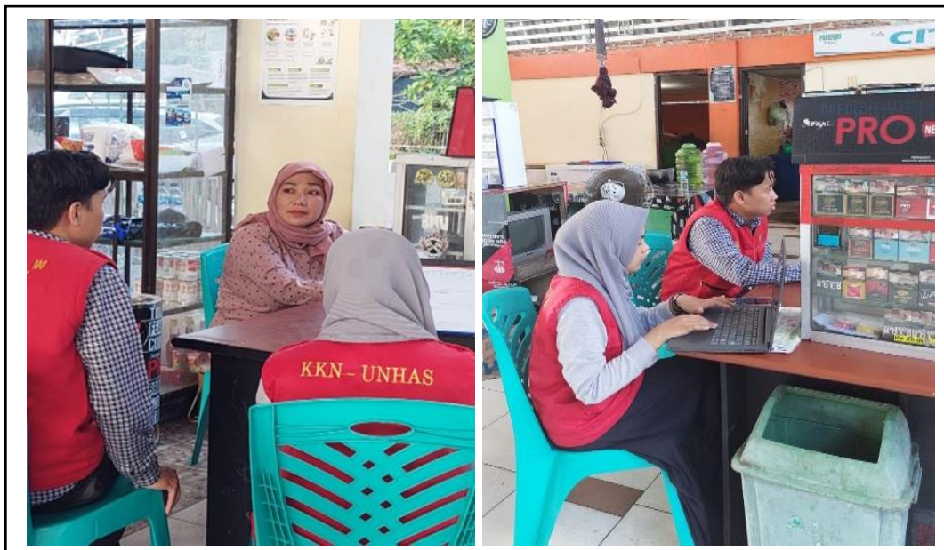
Gambar 5. Pendampingan pengisian dokumen Manual SJPH.

menjamin produksi halal, serta melakukan pendampingan untuk memperoleh sertifikasi halal dari MUI. Pada kegiatan pendampingan ini, proses pendampingan dilakukan secara langsung dengan melakukan kunjungan ke lokasi pelaku usaha di Kawasan wisata kuliner Pare Beach.