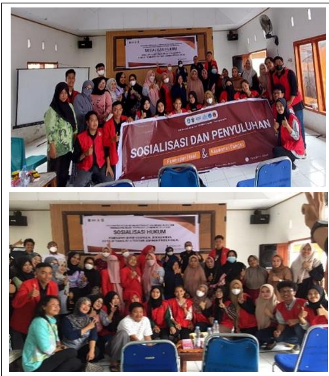
Gambar 6. Sosialisasi Penerapan Halal, Hukum, Penyelia dan Penyuluhan Keamanan Pangan.

sertifikasi halal dan penyuluhan keamanan pangan dilaksanakan secara Bersama. Kegiatan dilakukan bersamaan untuk efektivitas waktu. Kegiatan dilaksanakan di Aula Kecamatan Soreang dengan mendatangkan narasumber dengan bidang keahlian masing-masing. Kegiatan sosialisasi dapat dilihat pada Gambar 6.