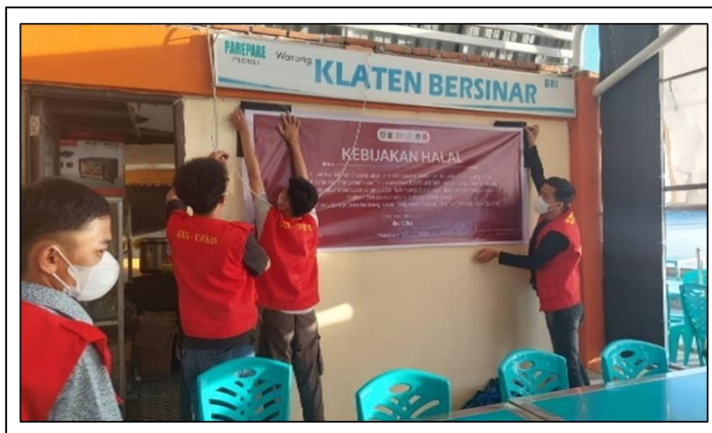
Gambar 4. Pemasangan spanduk kebijakan pada unit usaha UMKM.