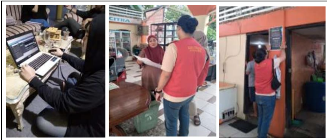
Gambar 3. Disain, Edukasi dan Penempelen Media Poster edukasi halal di Pare Beach.

Program Kerja Sosialisasi Kebijakan dan Edukasi Halal melalui Media Poster di Kawasan Kuliner Pare Beach Parepare terlaksana dan mendapat impresi yang positif. Hal ini dapat dilihat dari respon pelaku usaha di kawasan Pare Beach dalam menerima poster yang dibagikan. Kondisi ini merupakan satu indikasi bahwa pelaku usaha di kawasan Pare Beach membutuhkannya dan tertarik untuk memahami terkait penerapan halal. Para pelaku usaha di kawasan Pare Beach 1 menyambut dengan sangat baik dan mendukung segala bentuk kegiatan yang dilaksanakan.