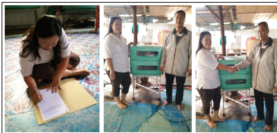
Gambar 3. Penandatanganan berita acara dan penyerahan 1 set oven gas kepada ukm I sun vera