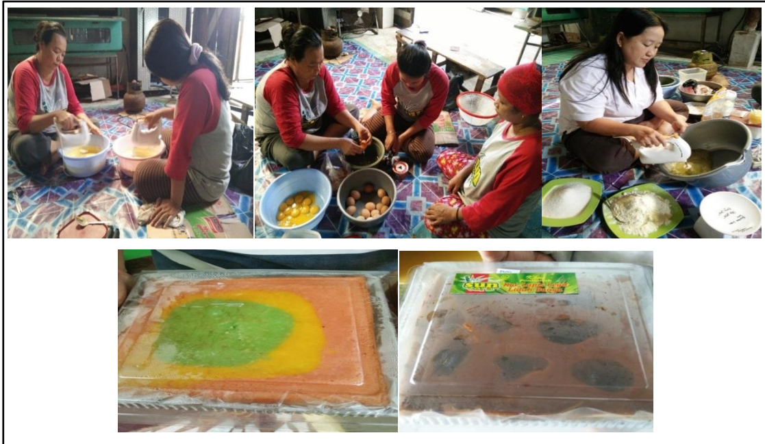
Gambar 1. Praktek pembuatan (Atas) dan hasil jamu kunyit asam berbasis aloe(bawah)