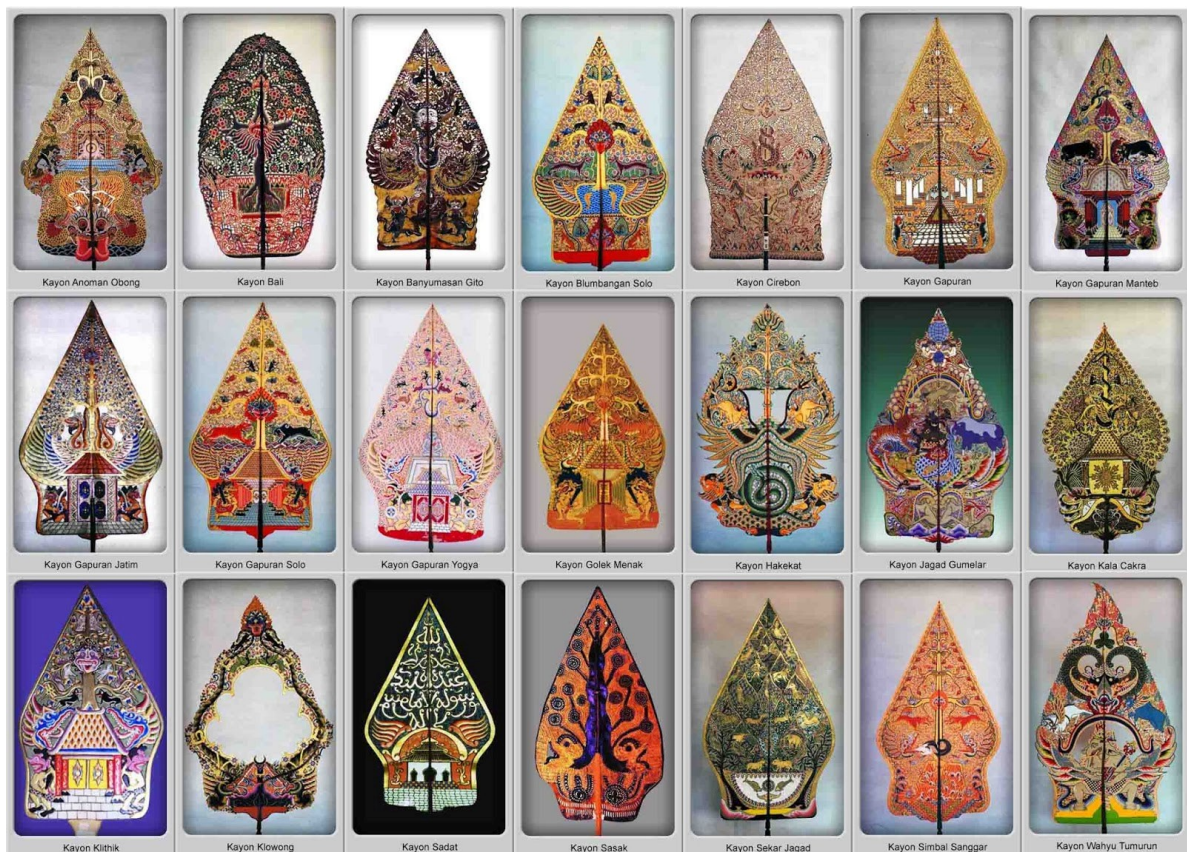
Gambar 1. Model-Model Gunungan yang Digunakan Dalam Kesenian Wayang Kulit

Sumber gambar: https://3.bp.blogspot.com/ diakses pada 29 Oktober 2022