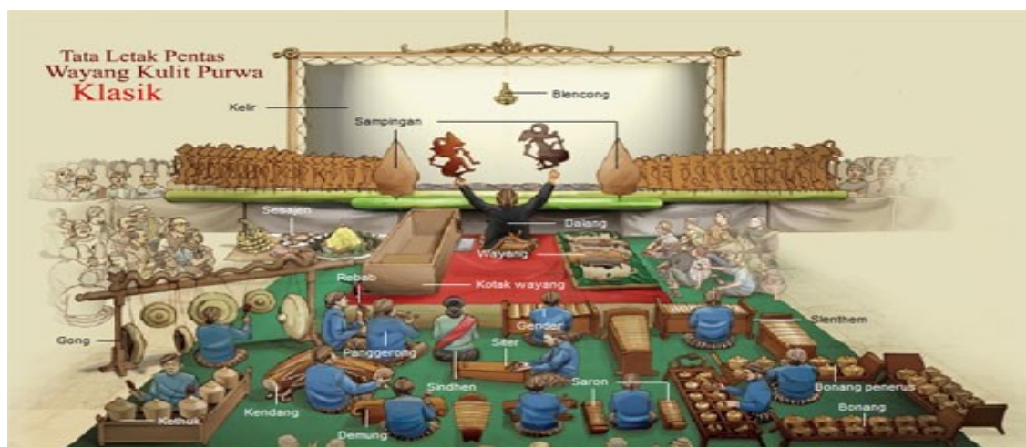
Gambar 4. Tata Letak Pentas Wayang Kulit Purwa Klasik