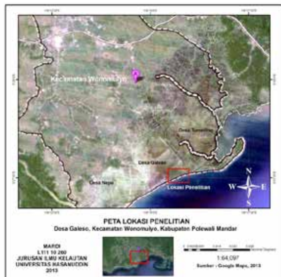
Gambar 1. Peta lokasi penelitian.

Penelitian ini telah dilaksanakan Mei 2014. Lokasi penelitian dilakukan pantai Mampie pada kawasan konservasi mangrove Kecamatan Wonomulyo Kabupaten Polewali Mandar Provinsi Sulawesi Barat (Gambar 1). Sedangkan analisis sampel bahan organik total (BOT) dilakukan di Laboratorium Geomorfologi dan Manajemen Pantai (GMP) dan Laboratorium Kimia Oseanografi, Departemen Ilmu Kelautan Fakultas Ilmu Kelautan dan Perikanan.