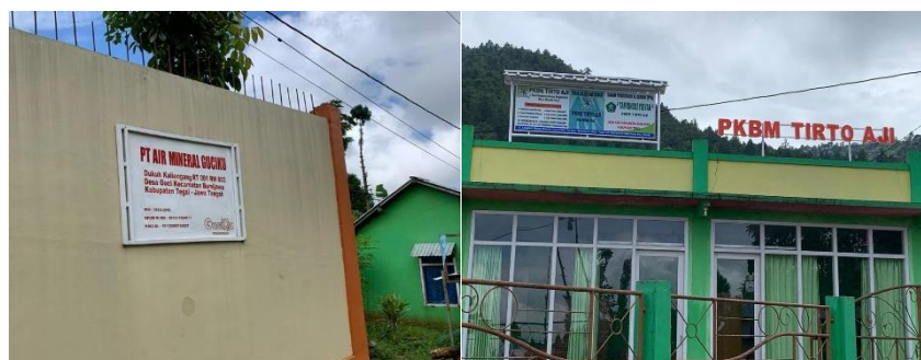
Gambar 6. Pabrik Air Minum Guci dan PKBM Tirto Aji yang berada di Desa Guci.

Fasilitas wisatawan adalah sumber daya alam dan sumber daya buatan manusia yang harus digunakan oleh wisatawan dalam perjalanan untuk tujuan wisata. Fasilitas wisatawan disebut sebagai ujung tombak usaha kepariwisataan dapat diartikan sebagai usaha yang secara langsung maupun tidak langsung memberikan pelayanan kepada wisatawan pada suatu daerah tujuan wisata dimana keberadaannya sangat tergantung kepada adanya kegiatan perjalanan wisata (Sarim, 2017).