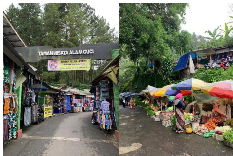
Gambar 5. Pasar Desa dan Pasar Cenderamata sebagai Fasilitas Pendukung di Obyek Wisata Pemandian Air Panas Guci.

Fasilitas wisata merupakan pelengkap daerah tujuan wisata yang diperlukan untuk memenuhi kebutuhan dari wisatawan yang sedang menikmati perjalanan wisata. Fasilitas wisatan dibuat untuk mendukung konsep atraksi wisata yang sudah ada. Karena itu selain daya tarik wisata, kegiatan wisata yang dilakukan wisatawan membutuhkan adanya fasilitas wisatan yang menunjang kegiatan wisata tersebut (Spillane, 1994).