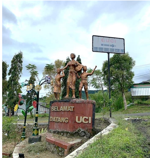
Gambar 2. Patung Ibu dan Anak di Pintu Masuk Kawasan Desa Guci.

Untuk memasuki kawasan Pemandian Air Panas Guci, maka pengunjung diharuskan mengeluarkan biaya sebesar Rp13.000,- untuk pengunjung dewasa di hari libur dan sebesar Rp12.000,- untuk pengunjung anak-anak di hari libur. Sedangkan dihari biasa pengunjung dewasa harus mengeluarkan biaya sebesar Rp10.000,- dan pengunjung anak-anak diharuskan mengeluarkan biaya sebesar Rp9.000,-. (Peraturan Daerah, 2021).