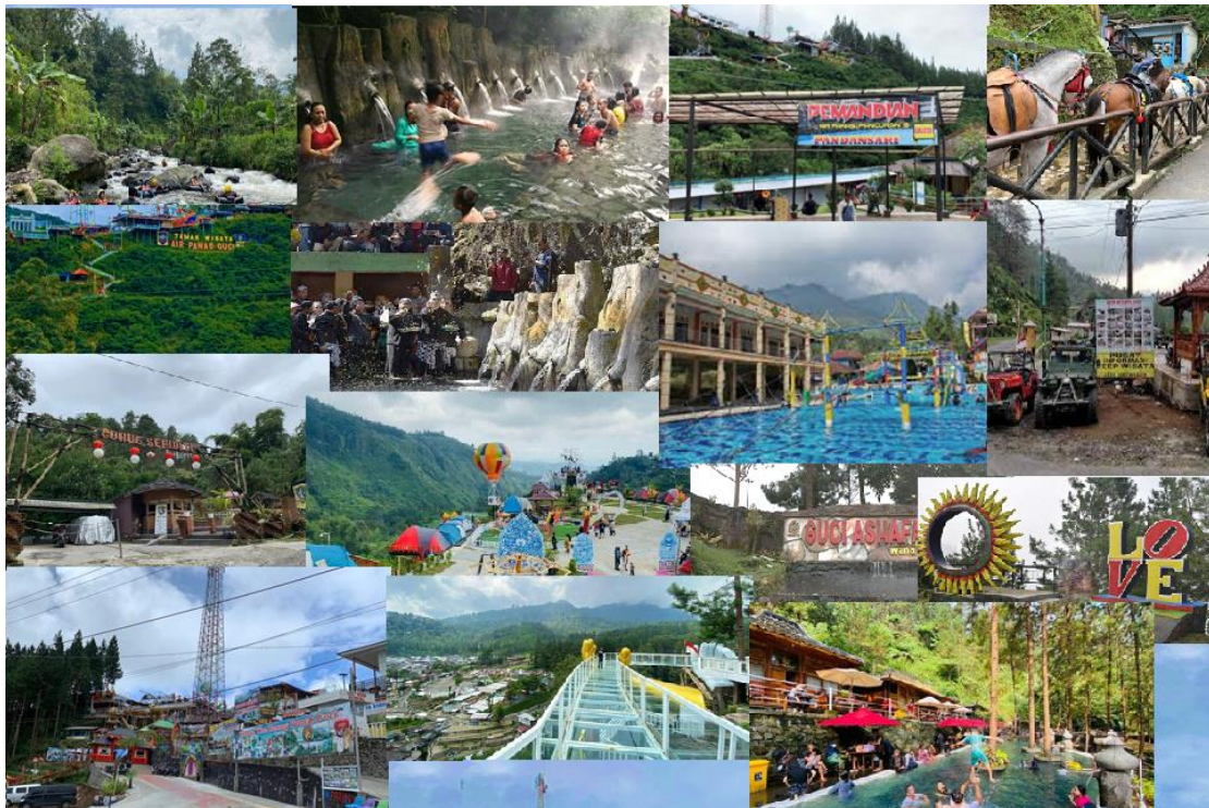
Gambar 4. Berbagai Atraksi yang dapat dinikmati di Obyek Wisata Pemandian Air Panas Guci.

handal juga didukung dengan atraksi wisata handal dan ditambah dengan taman wisata dengan segala potensinya yang dapat dilihat sebagai berikut.