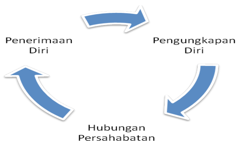
Gambar 2. Bentuk Pengungkapan Diri Mantan Penderita Kusta