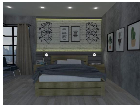
Hasil gambar modeling