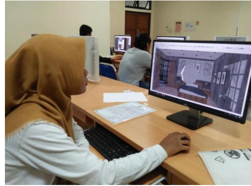
Siswa SMKN 2 Surakarta mulai mendesain