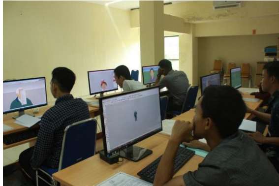
Siswa SMKN 2 Surakarta sedang belajar dan pengenalan software