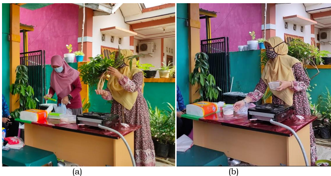
Gambar 1. Sosialisasi Memperkenalkan tumbuhan umbi garut (a) beserta tepung umbi garut dan tepung ikan (b)

Kegiatan Pengabdian Kepada Masyarakat ini dimulai dengan memperkenalkan tumbuhan umbi garut terlebih dahulu dan manfaat penggunaan tepung umbi garut bagi tubuh terutama para lansia, anak-anak, ataupun orang-orang yang mengalami intoleransi terhadap keberadaan gluten pada tepung terigu yang biasa digunakan masyarakat untuk membuat mie basah. Kemudian dilanjutkan dengan sosialisasi penggunaan tepung ikan bleberan untuk meningkatkan nilai ekonomis dan daya guna dari ikan bleberan sebagai pelengkap protein di mie basah yang akan diolah, selain itu dapat juga menjadi pemasukkan tambahan bagi warga jika ingin memproduksi dan memasarkan hasil olahan mie seperti pada Gambar 1.