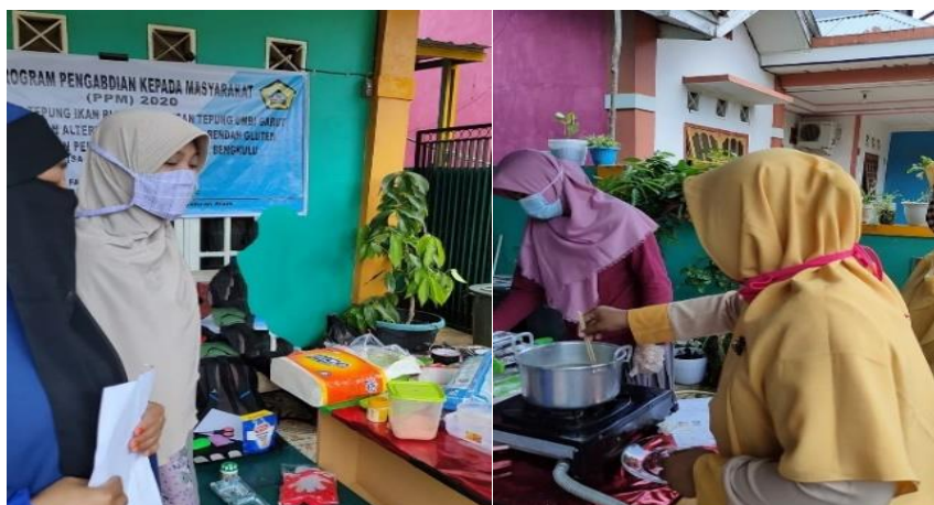
Gambar 3. Partisipasi warga selama pembuatan mie olahan tepung ikan dan tepung umbi garut

Selama proses kegiatan berlangsung terlihat antusias peserta dengan ikut berpartisipasi saat proses pembuatan mie (ditunjukkan pada Gambar 3 berikut).