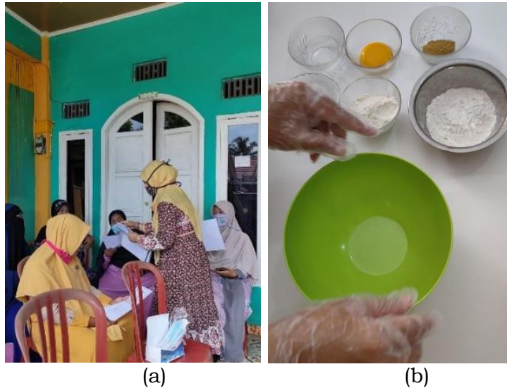
Gambar 2. Bahan yang akan digunakan (a); Pembagian brosur cara pengolahan (b)

Berikut tahapan pengolahan tepung umbi garut dan tepung ikan untuk menghasilkan mie basah: