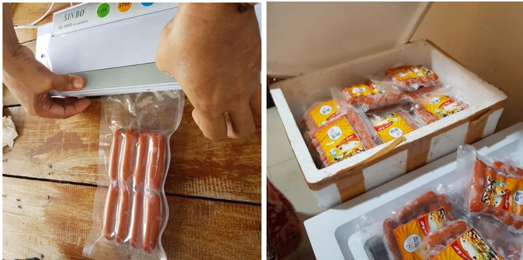
Gambar 7. Proses pengemasan produk sosis ikan patin

Bagian akhir dari penyuluhan dan bimbingan teknis ini adalah pengemasan produk sosis ikan dengan teknik pengemasan hampa udara menggunakan alat vacuum sealer (Gambar 7).