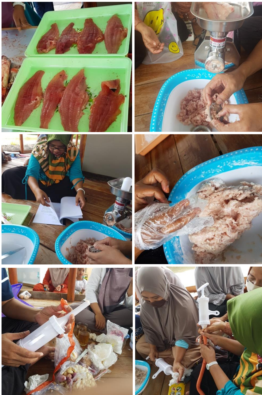
Gambar 5. Demonstrasi dan bimbingan teknis pengolahan sosis ikan patin