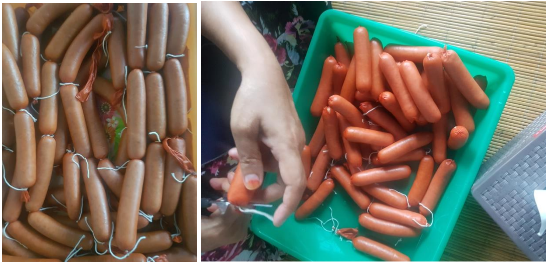
Gambar 6. Produk sosis berbahan baku ikan patin

Bagian akhir dari penyuluhan dan bimbingan teknis ini adalah pengemasan produk sosis ikan dengan teknik pengemasan hampa udara menggunakan alat vacuum sealer (Gambar 7).