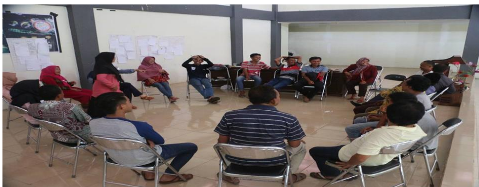
Gambar 2. Pelatihan kewirausahaan

Pelatihan kewirausahaan pada kelompok tani hutan dapat dilihat seperti pada gambar 2 berikut: