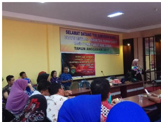
Gambar 1. Proses Kegiatan Sosialisasi dan In House Training Pelaporan IKP

Berdasarkan Tabel 2 di atas, dapat dilihat tingkat pengetahuan dan skill perawat sebelum mengikuti kegiatan sosialisasi dan in house training pelaporan IKP sebesar 4% berada dalam kategori baik dan setelah mengikuti kegiatan terjadi peningkatan pengetahuan menjadi 74%. Hal ini menggambarkan bahwa kegiatan sosialisasi dan in house training pelaporan IKP memberikan pengaruh terhadap peningkatan pengetahuan perawat.