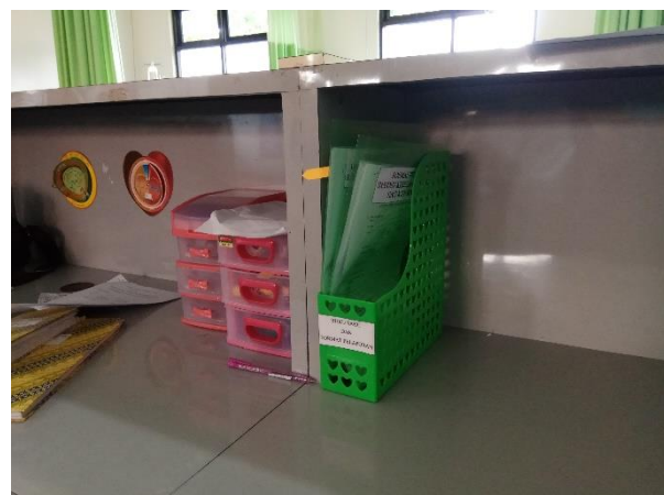
Gambar 2. Buku Saku Panduan Pelaporan IKP dan Kelengkapan Format Pelaporan IKP