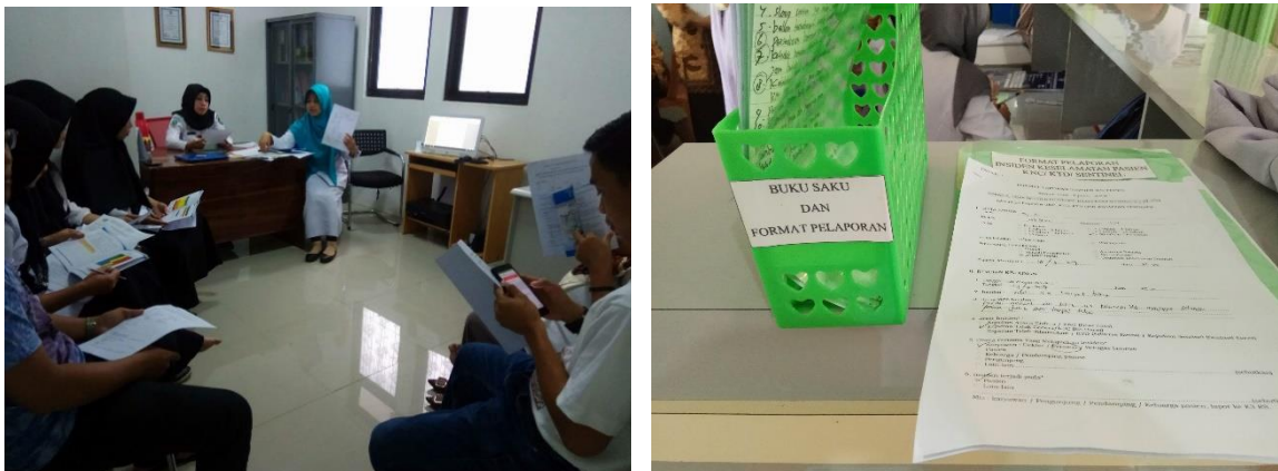
Gambar 3. Proses Pendampingan dan Monitoring Evaluasi Kegiatan di Ruang ICU

Pendampingan diberikan guna untuk memberikan informasi, arahan, pembelajaran dan evaluasi terkait dengan alur pelaporan insiden di Rumah Sakit dan pengisian format pelaporan IKP. Kegiatan pendampingan dilakukan untuk mendampingi perawat di ruangan percontohan yaitu ruang ICU dalam penerapan budaya melapor setiap insiden yang ditemui di ruangan. Gambar 3 dapat dilihat proses pendampingan dan monitoring evaluasi kegiatan di ruang ICU. Pada awalnya perawat di ruangan masih ragu melakukan pelaporan IKP karena takut disalahkan, padahal prinsip budaya dalam pelaporan IKP adalah “ no blame ”. Setelah dilakukan pendampingan dan monitoring evaluasi pelaporan IKP di ruang ICU, 82% telah berjalan dengan baik. Pada minggu pertama, pelaporan insiden masih dalam tahap sosialisasi dan pengenalan bagi perawat di ruangan ICU. Namun pada minggu kedua, perawat di ruangan sudah mampu beradaptasi dengan perubahan ini dan melakukan pelaporan sebagai kewajibannya dalam memperbaiki mutu pelayanan di Rumah Sakit khususnya di ruangan ICU. Sampai saat ini, beberapa laporan insiden baik KPC maupun KTD telah dibuatkan laporan dalam format pelaporan yang telah disediakan dan sudah dalam proses penanganan oleh Kepala Ruangan dan Penanggung Jawab Unit Keselamatan Pasien di ruangan.