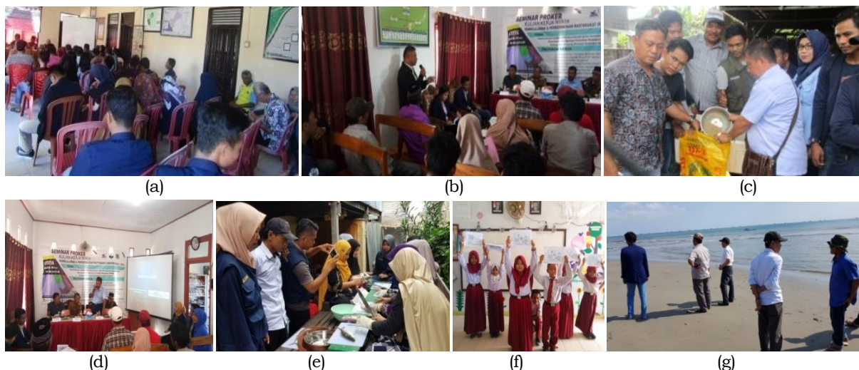
Gambar 3. Kegiatan penyuluhan: (a) budidayaberbasisnitrobakter, (b) budidaya sistem minapadi, (c) pembuatan pakan, (d) budidaya akuaponik, (e) diversifikasi olahan ikan, (f) edukasi dini perikanan dan kelautan, (g) identifikasi wisata laut

Penyuluhan teknis dilakukan untuk memberikan keterampilan teknis kepada khalayak sasaran terkait dengan program kerja yang akan dilaksanakan. Kegiatan ini juga diawali dengan apersepsi dengan mengajukan pertanyaan pancingan untuk mengetahui keterampilan awal yang telah dimiliki oleh khalayak sasaran. Hasil apersepsi menunjukkan bahwa umumnya keterampilan awal tentang hal-hal yang berkaitan dengan program kerja yang akan dilaksanakan masih relatif terbatas. Mengacu kepada hasil apersepsi tersebut, selanjutnya dilakukan penyuluhan dengan materi yang terkait dengan tata cara persiapan dan pemeliharaan udang bandeng serta aplikasi nitrobakter (waktu, dosis, dan metode penerapan), pembuatan konstruksi serta persiapan dan pemeliharaan sistem budidaya minapadi dan akuaponik, teknik cabut duri dan pengolahan ikan bandeng (nugget, kerupuk kulit, lumpia, bandeng krispi, dan abon), pembuatan pakan, dan identifikasi kesesuaian perairan untuk wisata laut.