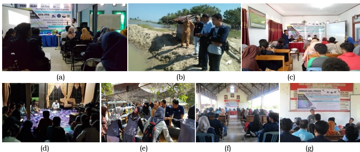
Gambar 2. Rangkaian kegiatan pengabdian : (a) Pembekalan, (b) Sosialisasi, (c) Seminar program kerja, (d) dan (e) supervisi, (e), dan (f) Seminar hasil program kerja