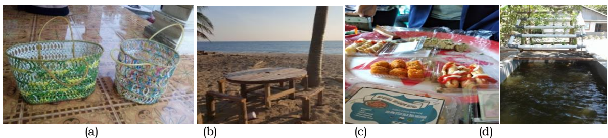
Gambar 5. Beberapa produk program kerja: (a) tas dari limbah, (b) fasilitas wisata pantai, (c) olahan hasil perikanan, (d) akuaponik