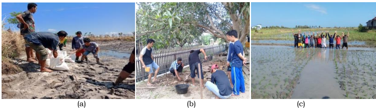
Gambar 4. Kegiatan demonstrasi dan pendampingan di lahan percontohan : (a) budidaya berbasis nitrobakter, (b) budidaya akuaponik, (c) budidaya minapadi

Pembuatan lahan percontohan dilakukan bersama-sama dengan khalayak sasaran, mulai dari persiapan, pembuatan konstruksi, penebaran, sampai dengan pemeliharaan dan pengontrolan. Hasil kegiatan demonstrasi menunjukkan bahwa khalayak sasaran umumnya telah menguasai secara teknis kegiatan pemeliharaan ikan, namun inovasi teknologi nitrobakter, akuaponik, dan minapadi masih memerlukan pendampingan karena merupakan hal baru bagi khalayak sasaran. Setelah dilakukan pendampingan yang terjadwal, proses-proses budidaya dan paket teknologinya akhirnya dapat dipahami dan dikuasai oleh khalayak sasaran. Keberadaan lahan percontohan memberikan media pembelajaran bagi masyarakat setempat. Hal ini dapat dilihat dari kunjungan beberapa masyarakat di lokasi lahan percontohan untuk berdiskusi dan menyatakan keinginannya untuk menerapkan inovasi yang telah diperkenalkan.