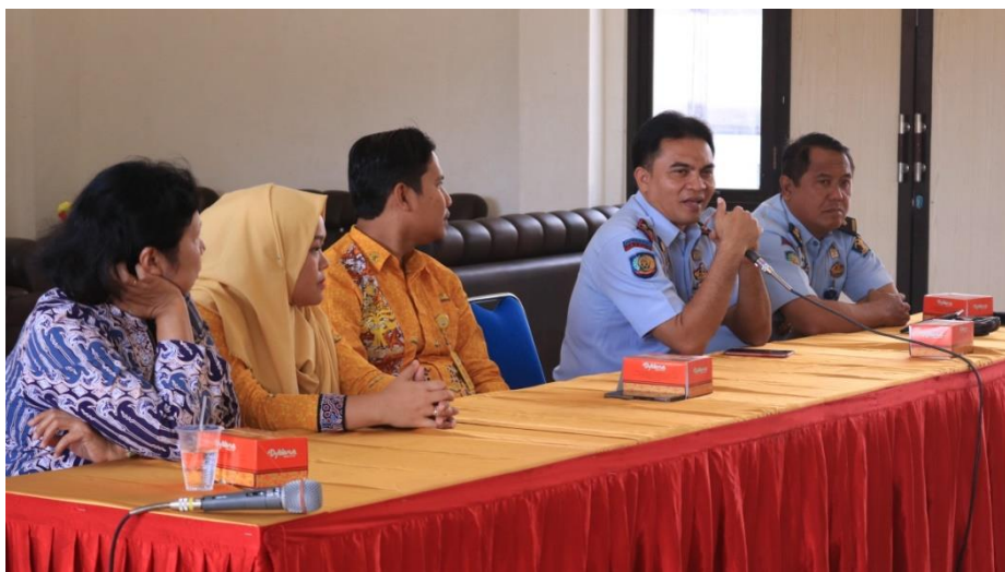
Gambar 2. Sambutan Kepala Lapas Terbuka Kelas IIB Kendal

Hasil kegiatan yang merupakan program pengabdian tahap selanjutnya adalah focus group discussion (FGD) dan workshop literasi keuangan bagi warga binaan dan pegawai lapas. Kegiatan ini dilakukan pada hari Kamis, 18 Juli 2019. Hal ini dilakukan mengingat kesepakatan dan kesesuaian jadwal tim pengabdian dengan kepala bagian pembinaan lapas terbuka kelas IIB Kendal. Kegiatan diselenggarakan mulai pukul 08.00 WIB sampai dengan pukul 13.00 WIB, di gedung serbaguna kawasan pembinaan lapas produktif dan dibuka langsung oleh kepala Lembaga Perasyarakatan Terbuka Kelas IIB Kendal (Gambar 1). Kegiatan ini dihadiri oleh tim pengabdian kepada masyarakat fakultas ekonomi dan pegawai lapas terbuka kelas IIB Kendal serta warga binaan. Total peserta 60 orang.