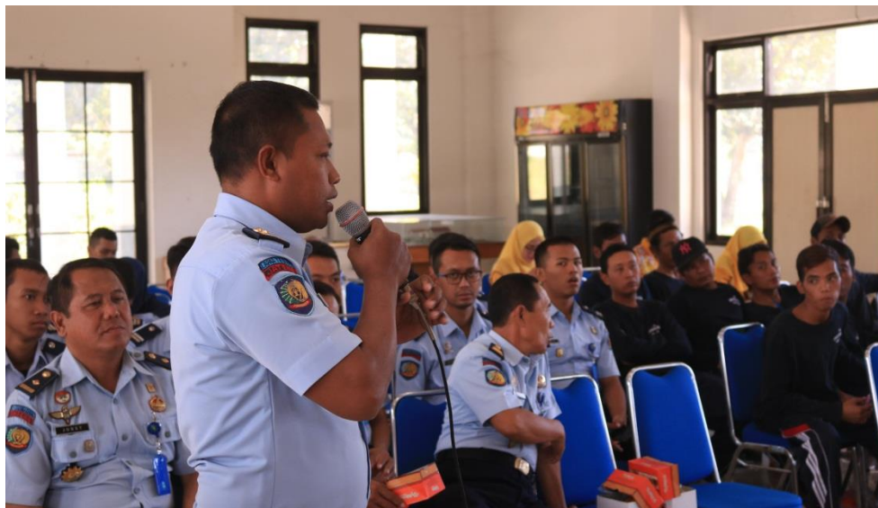
Gambar 5. Diskusi dan Tanya Jawab Workshop