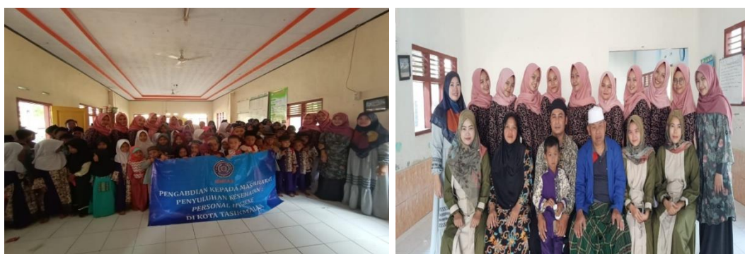
Gambar 1. Santri Miftahul Khoer (kiri) dan Tim Pengabdian bersama mitra (kanan)

Tempat dan waktu. Kegiatan penyuluhan kesehatan personal hygiene dilakukan di TKA/TPA/DTA Miftahul Khoer Kelurahan Ciherang, Kecamatan Cibeureum Kota Tasikmalaya pada tanggal 30 Juli 2019, jam 13.00 s/d selesai (Gambar 1).