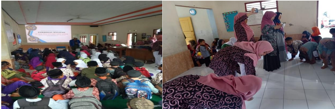
Gambar 4. Edukasi personal hygiene

Adapun praktek/demonstrasi yang diberikan ialah menggosok gigi dengan baik dan benar, olahraga sederhana yang teratur dan terukur, serta Mencuci tangan yang baik dan benar menggunakan sabun dan air yang mengalir.