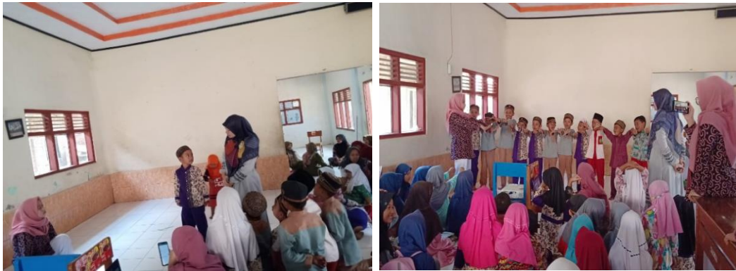
Gambar 2. Kegiatan pre test (kiri) dan post test (kanan)