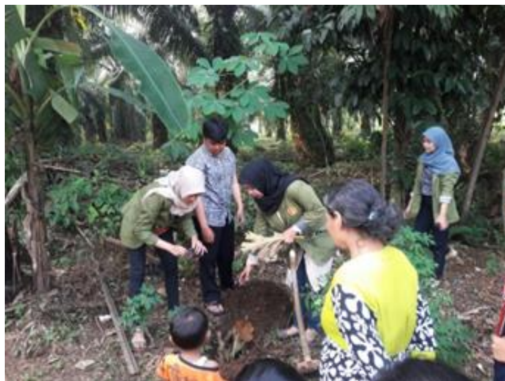
Gambar 3. Proses pembuatan kompos didampingi oleh Dinas Pertanian Kabupaten Bogor

Proses pembuatan pupuk kompos diberikan penyuluhan terlebih dahulu kepada warga dengan didampingi Dinas Pertanian Kabupaten Bogor yaitu bagaimana teknik membuatnya serta mendemonstrasikan. Prosesnya dimulai dengan membuat lubang kedalaman 0,5 meter sampai 1 meter, lalu masukkan sampah organik (kulit buah, sisa sayuran, kulit kering atau daun-daun kering, serta kotoran hewan atau sekam padi). Setelah sampah organik dimasukkan dan diratakan serta beri kotoran hewan/sekam setinggi 5 cm, tutup lubang dengan