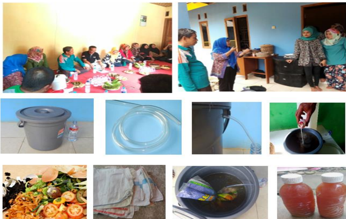
Gambar 4. Proses pembuatan pupuk cair didampingi oleh Dinas Lingkungan Hidup Kabupaten Bogor

Manfaat kegiatan pembuatan pupuk kompos dan pupuk cair ini hamper sama dengan kegiatan pengabdian masyarakat dari Suhastyo (2017) bahwa cara teknologi memuat pupuk kompos menghasilkan faedah yang sangat tinggi karena adanya bertambahnya pengetahuan warga mengenai pemanfaatn sisa dari sampah-sampah organik yang merupakan sumber dasra untuk membuat pupuk kompos. Selain itu , prosedur pembuatan sampah menjadi pupuk organik menjadi peluang tambahan penghasilan ekonomi yang lebih besar, dan dengan adanya kemampuan masyarakat memproses pupuk organik atua pupuk kendang atau kompos ini menjadikan berkurangnya ketergantunga masyarakat dalam menggunakan pupuk anorganik (Yetri et al., 2018).