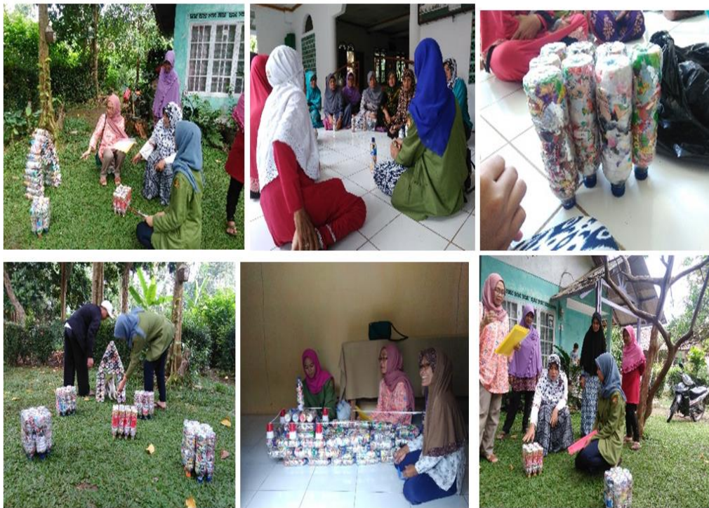
Gambar 5. Kegiatan pembuatan ecobrick

Kegiatan ecobrick membutuhkan bahan berupa: 1) sampah rumah tangga berupa botol minuman atau kemasan plastik bekas makanan atau minuman yang sudah dikumpulkan oleh warga di bank sampah; 2) Lem tembak khusus untuk plastik. Atau Lem Fox atau lem besi .3) Gunting. 4) Kayu atau Besi untuk memadatkan plastic di dalam botol. 5) air dan sabun cuci. Proses pembuatan: cuci semua bahan yang akan digunakan setelah itu dikeringkan (dapat dijemur lalu dilap), kemudian bahan plastik kemasan digunting-gunting; hasil guntingan dimasukkan ke dalam botol sampai padat, lalu tutup rapat; lalu sambungkan antar tiap botol sesuai pola yang ingin dibentuk (dapat berupa bangkai atau meja). Langkah diatas sesuai dengan SOP adalah sebagai berikut: (1) adanya penambahan prosedur memotong kecil-kecil sampah plastik dengan tujuan untuk menambah estetika dari produk ecobrick sehingga dapat menambah nilai jual produk, dan (2) adanya penimbangan sebagai standar berat yang digunakan pada produk ecobrick yaitu 2 ons dengan tujuan adanya pengontrolan kualitas ( quality control ) yang paling bagus dan selalu tetap dari produk ecobrick yang dihasilkan (Asih & Fitriani, 2018).