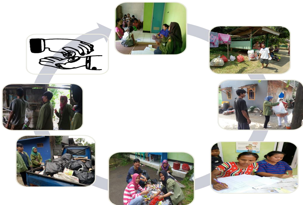
Gambar 2. Proses bank sampah