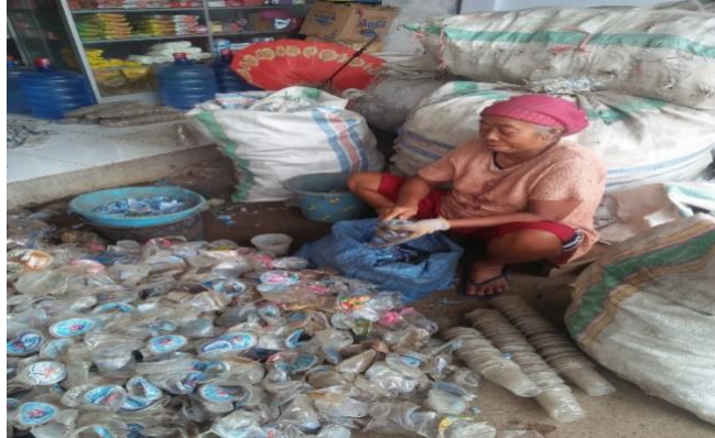
Gambar 2. Perempuan Pesisir Mengolah Sampah Plastik

persentase sebesar 100 persen sangat setuju 4. Botol/gelas plastik tidak boleh dibuang ditempat terbuka karena dapat menjadi tempat berkembang biaknya nyamuk dengan hasil persentase sebesar 100 persen sangat setuju. 5. Setiap ibu rumah tangga harus menyediakan tempat sampah sendiri untuk memisahkan sampah plastik dengan hasil persentase sebesar 100 persen sangat setuju 6. Membuang sampah ke sungai/laut karena dapat mencemari sungai/laut. dengan hasil persentase sebesar 100 persen sangat setuju 7. Sampah basah dan sampah kering perlu tempat tersendiri dengan hasil persentase sebesar 100 persen.