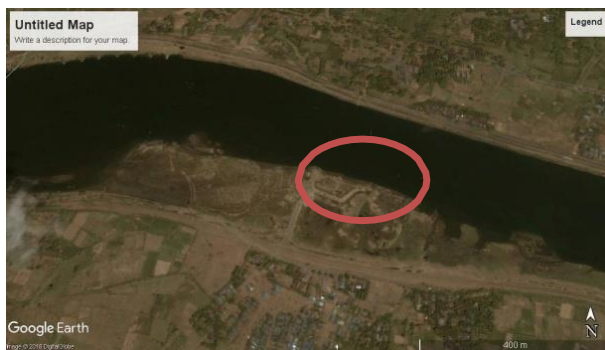
a). Kondisi sekitar Sungai Jeneberang Tahun 2000

Sebagai salah satu sumber air, sungai telah memegang fungsi yang sangat penting bagi kehidupan dan penghidupan. Seperti yang dilihat dari tahun ke tahun Sungai Jeneberang mengalami perubahan. Pada tahun 2000 penduduk di sekitar Sungai Jeneberang masih memberlakukan sempadan sungai, seperti yang dapat dilihat pada Gambar 2 (a). Pada tahun 2018 penduduknya mulai membangun di sekitar sungai tersebut seperti Gambar 2 (b), penduduk di sekitar tidak lagi memperhatikan sempadan sungai.