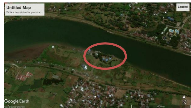
(b). Kondisi sekitar Sungai Jeneberang Tahun 2018