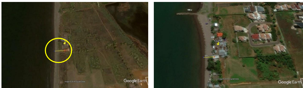
(a) Tahun 2000

Pada Gambar 4 tahun 2000 bagian (a) bangunan masyarakat pesisir Tanjung Bunga tidak memenuhi syarat batasan sempadan pantai yaitu minimal 100 meter dari pantai pada saat pasang tertinggi. Batas sempadan pantai tahun 2000 pada lokasi titik 1 sepanjang 27,02 meter. Gambar 4 bagian (b) pada tahun 2018 bangunan yang berada di sekitar pesisir Tanjung Bunga telah berkembang pesat dan pelanggaran terhadap batas sempadan pantai semakin marak, jarak bangunan masyarakat Tanjung Bunga ke tepi pantai berjarak 22,55 meter. Dari kurun waktu tahun 2000–2018, telah terjadi kemunduran garis pantai sepanjang 4,47 meter. Ini merupakan salah satu fenomena alam yang dapat menunjukkan potensi bencana di kawasan Pantai Tanjung Bunga.