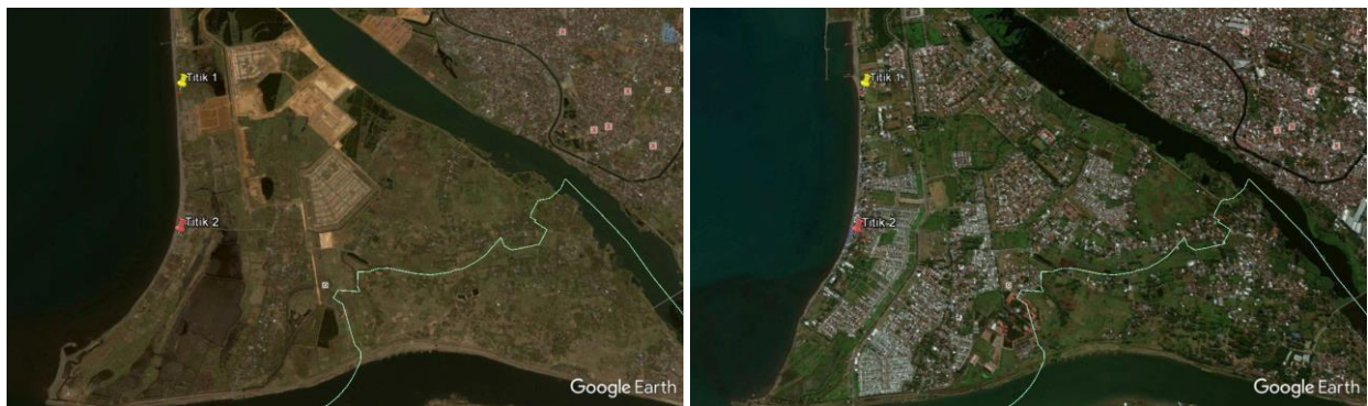
(a) Tahun 2000