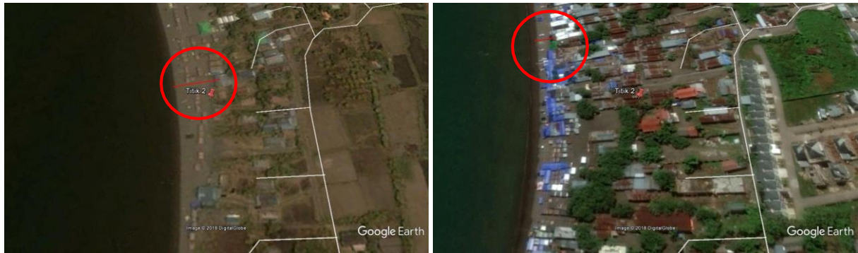
(a) Tahun 2000