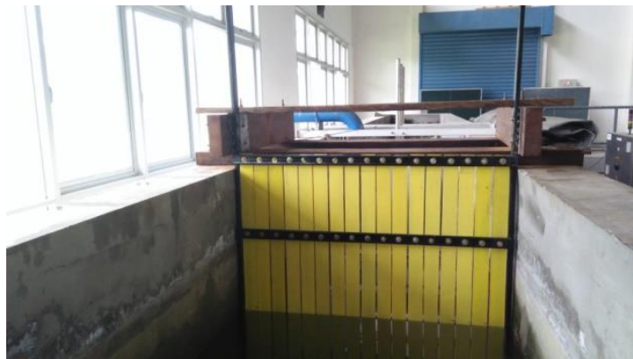
Gambar 2. Penempatan model di dalam flume