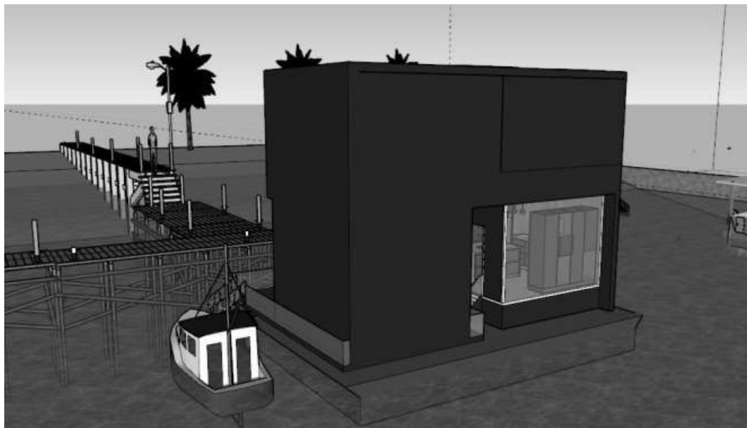
Gambar 1. Menentukan Desain

Villa merupakan salah satu akomodasi wisata yang biasanya terletak tidak jauh dari daerah wisata. Sasaran pengunjung villa adalah wisatawan yang bertujuan untuk berlibur, bersenang-senang, mengisi waktu luang dan merupakan rutinitas bekerja sehari-sehari yang membosakan. Tujuan dari perancangan villa ini yaitu sebagai penunjang aktivitas wisata yang merupakan kegiatan utama yang dikonsentrasikan dikawasan ini. Selain itu, resort ini juga dirancang dengan tujuan untuk disewakan atau dipergunakan. Selain itu sasaran dari villa adalah investor luar yang ingin berinvestasi [2].