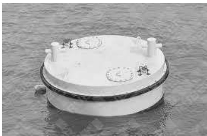
Gambar 1. Mooring Buoy

oilspill (minyak tumpah) di laut pada saat proses pengisian dan transfer hasil minyak bumi. Hal tersebut disebabkan karena sistem tambat yang tidak mumpuni menahan gaya yang diberikan oleh kapal tanker atau Floating Production, Storage & Offloading (FPSO). Sistem tambat pada kapal haruslah sesuai standar yaitu disesuaikan dengan besarnya DWT kapal yang akan bertambat.