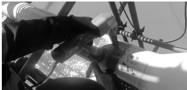
Gambar 5 Pengetesan benda uji dengan Magnetic Particle Test .

Magnetic Particle Testing (MPT) merupakan salah metode pengujian tidak merusak yang dapat digunakan untuk mencair diskontinuitas dan memanfaatkan partikel yang dapat merusak benda uji pada permukaan material dan pada daerah sedikit di sub-surface . Metode ini tergolong memiliki tingkat sensitivitas deteksi cacat yang tinggi. Namun, sebelum penggunaan metode ini, inspector harus memastikan alat-alat ini sudah terkalibrasi terlebih dahulu.