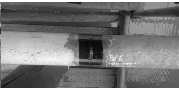
Gambar 9. Pengujian benda uji setelah menggunakan Visual Test

Mengacu pada gambar (8), dalam 2 metode NDT ini, metode dye penetrant test lebih efektif mendeteksi adanya cacat las. Namun dalam kemudahan dan biaya yang minim, VT merupakan metode yang dapat dipertimbangkan. Namun untuk VT, manusia memiliki batas dalam penglihatan. Akan tetapi, banyak inspector menggunakan kaca pembesar atau lup untuk melihat lebih detail akan cacat las. Oleh karena itu, untuk perbandingan 2 metode ini, dye penetrant test adalah metode yang tepat untuk mencari celah dalam benda uji material.