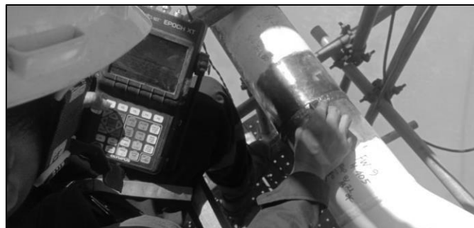
Gambar 6. Pengetesan benda uji dengan Ultrasonic Test

Metode ini dapat digunakan untuk mendeteksi material thickness dengan memanfaatkan pantulan gelombang dari transduser. Metode ini merupakan salah satu jenis NDT yang memanfaatkan frekuensi tinggi atau getaran bunyi untuk melakukan proses pengujian dan proses pengukuran. Besarnya frekuensi gelombang ultrasonik yg dipergunakan untuk pengujian ini pada atas 20 khz. Metode dapat digunakan padabenda yg bersifat logam serta non-logam.