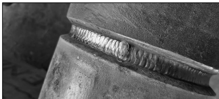
Gambar 7. Indikasi Porosity pada benda uji material

Pengujian dye penetrant test dilaksanakan di PT. Kaliraya Sari dengan beberapa titik joint pada Piping HRB-33 sebagai benda uji material, terindikasi adanya cacat las berupa porosity . Mengacu pada American Petroleum Institute (API) , Porosity merupakan indikasi cacat las ketika gas terperangkap atau memadat pada hasil lasan. Lihat Gambar 7. Untuk kasus porosity , jika cacat las nya memiliki ukuran 3 mm atau lebih dapat dikatakan terindikasi oleh cacat las porosity . Untuk acceptance criteria nya, jika porosity kurang dari 3 mm dapat diterima. Namun, cacat las dapat terjadi jika welder nya tidak terampil, travel speed tidak sesuai dengan Welder Procedure Spesification (WPS) atau amphere las nya terlalu tinggi atau rendah. Akan tetapi, untuk memulai kegiatan welding , alat – alat las harus di kalibrasi terlebih dahulu supaya tidak terjadi adanya cacat las kedepannya.