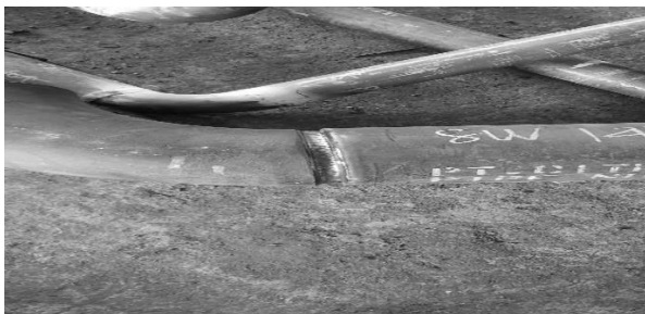
Gambar 8. Pengujian benda uji setelah menggunakan Dye Penetrant Test