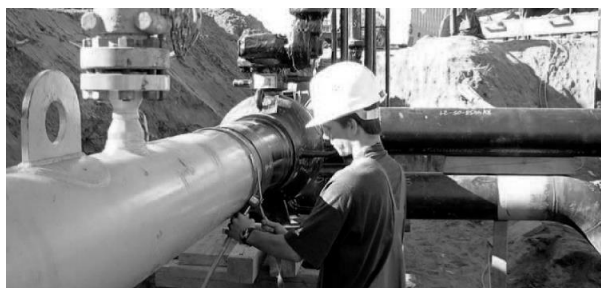
Gambar 4. Pengetesan benda uji dengan Radiography Test

Metode Radiography Test adalah salah satu metode NDT yang memanfaatkan sumber radiasi sinar gamma atau mesin sinar X untuk mengetahui cacat pada suatu material uji atau joint . Radiasi sinar gamma adalah salah satu bentuk pemanfaatan radiasi yang terdapat di zat radioaktif atau radioisotop. Lihat Gambar 4. prinsip kerja metode Radiography Test ini adalah menggunakan paparan radiasi yang dihasilkan oleh asal radiasi yg diarahkan ke objek yang akan diperiksa (benda uji) serta dibalik obyek yang telah diletakkan film yang akan merekam hasil pemotretan radiografi. Film ini disinari oleh radiasi dalam waktu tertentu, lama waktu penyinaran dipengaruhi oleh tebal objek yang diperiksa, jarak objek ke sumber radiasi, aktivitas sumber radiasi dan grade film yang digunakan.