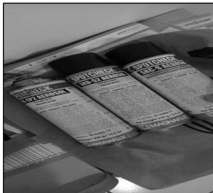
Gambar 3. Cairan Penetrant , Excess Remover dan Developer

Istilah material penetrant yang digunakan dalam prosedur ini. dimaksudkan yaitu termasuk semua penetrant , atau agen. Mengacu pada Gambar 3. Teknik ini memanfaatkan 3 liquid yang terdiri dari excess remover , developer , dan penetrant . Sebelum tahap pemeriksaan ada halnya untuk mempersiapkan prosedur yang ditetapkan American Society Mechanical Engineering (ASME), dengan adanya regulasi tersebut dapat mempengaruhi keberhasilan pengujian dye penetrant . Untuk penggunaan metode ini, dapat digunakan dengan menyemprot, dan mengoles pada permukaan benda yang akan diuji. Sebelum pengujian terhadap benda yang diuji, permukaan tersebut harus dibersihkan dan disimpan pada tempat yang memiliki temperature 10 – 50 celcius untuk menghilangkan kelembapan pada benda yang akan diuji.