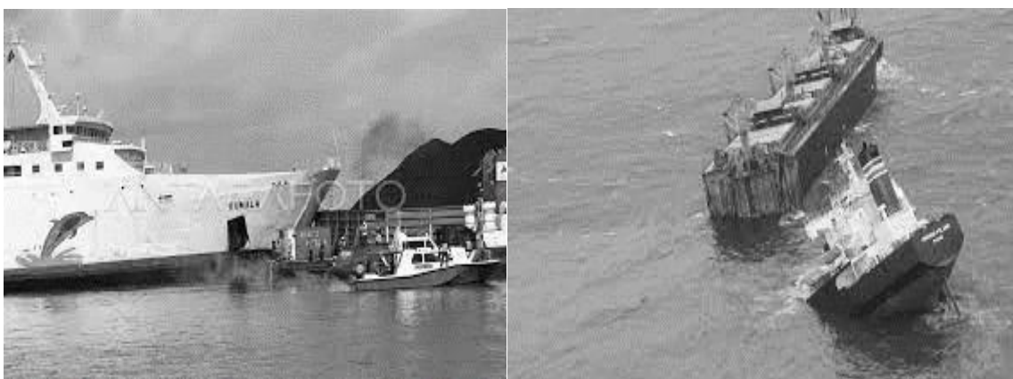
a). Tabrakan Kapal