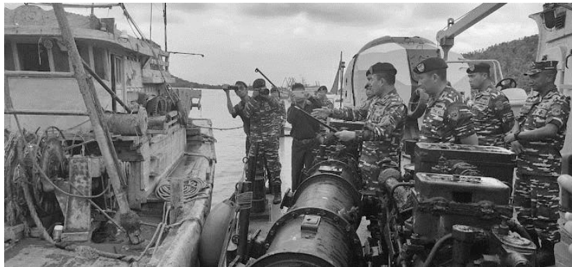
Gambar 3. Penangkapan Kapal Asing di Laut Indonesia