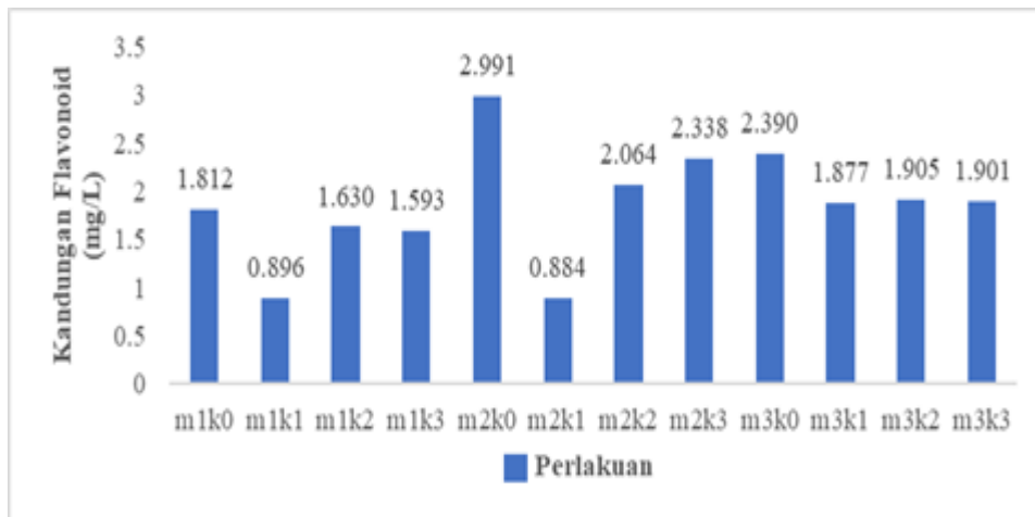
Gambar 2. Rata-rata kandungan flavonoid

sekam (m2) dengan konsentrasi air kelapa 0% (k0) yaitu 2.991 mg L -1 , sedangkan rata-rata kandungan flavonoid terendah yaitu perlakuan media tanam arang sekam (m2) dan konsentrasi air kelapa 15% (k1) yaitu 0.884 mg L -1 .