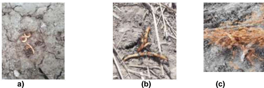
Gambar 2. Uji pemangsaan larva di pematang sawah (a) spesies semut Solenopsis sp , (b) spesies semut Delichoderus sp , (c) spesies semut Oecophylla sp

Berdasarkan data yang dihasilkan pada Tabl 7 terlihat bahwa jumlah waktu yang dibutuhkan oleh semut Oecophylla sp untuk melumpuhkan mangsa larva hidup yaitu 1784 detik sedangkan untuk melumpuhkan larva mati dibutuhkan waktu selama 478 detik. Pada spesies Delichoderus sp membutuhkan waktu selama 1699 detik untuk melumpuhkan larva hidup sedangkan untuk melumpuhkan larva mati dibutuhkan waktu selama 994 detik. Untuk spesies semut Solenopsis sp membutuhkan waktu selama 1090 detik untuk melumpuhkan mangsa hidup dan 788 detik untuk melumpuhkan mangsa mati.