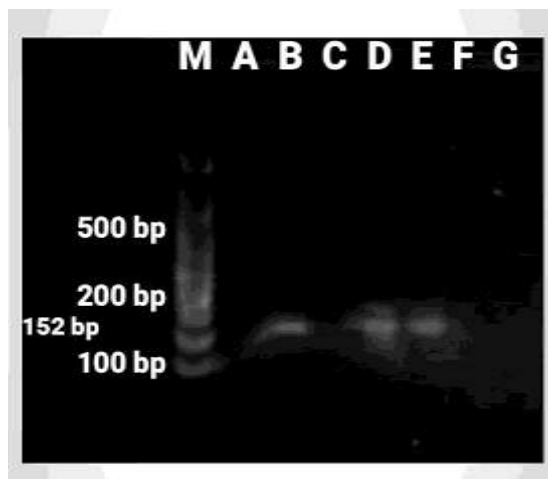
Gambar 2. Hasil Visualisas Tumor Necrosis Factor Alpha . Terdapat pita DNA pada sampel B, D, dan E