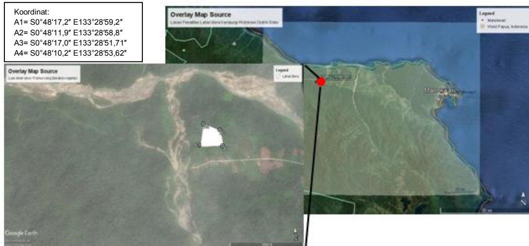
Gambar 1. Lokasi lahan bera 15 tahun Kampung Womnowi, Distrik Sidey Manokwari (Citra Map Source dan Google Earth)