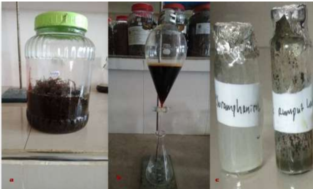
Gambar 1. (a). Proses maserasi; (b) pemisahan kadar garam; (c) Hasil ekstrak

Proses preparasi sampel adalah dimulai dengan proses maserasi hingga diperoleh ekstrak kental kemudian dilakukan pemisahan kadar garam dan terbentuk ekstrak murni dari Aglaophenia yang diperlihatkan pada Gambar 1 berikut: