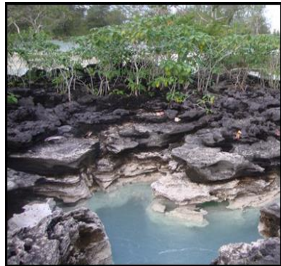
Gambar 3. Kenampakan warna mataair panas.

Rasa asin dari mataair panas didukung oleh hasil analisis kimia mataair panas yang mengandung kadar salinitas sebesar 20%, hal ini terjadi karena daerah terdapatnya mataair panas berdekatan dengan daerah laut, ditunjukkan juga dengan nilai Klorida (Cl) yang tinggi yang menyebabkan terjadinya reaksi Natrium (Na) yang dikandung mataair panas dengan ion klorida sehingga menimbulkan rasa asin dari mataair panas yang berpengaruh terhadap nilai pH dari keenam sampel mataair panas yaitu rata-rata 7,8-7,9.