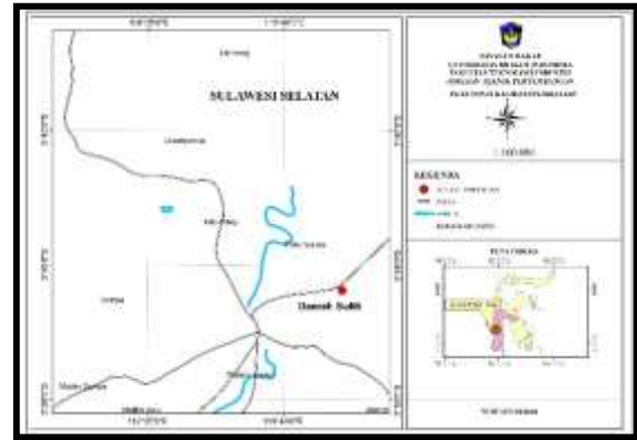
Gambar 1. Peta Lokasi Penelitian.

Berdasarkan observasi lapangan Daerah Sulili (Gambar 1) menunjukkan salah satu bentuk manifestasi panas bumi berupa mata air panas (Gambar 2). Manifestasi panas bumi terjadi karena adanya rekahan yang mengindikasikan fluida panas ke luar pada permukaan. Rekahan dapat terbentuk karena adanya struktur geologi (Umar dan Jamaluddin, 2018). Olehnya itu, dilakukan penelitian untuk mengeksplorasi lebih detail mengenai analisis struktur geologi mata air panas Daerah Sulili Kecamatan Paleteang Kabupaten Pinrang Provinsi Sulawesi Selatan sebagai data penunjang eksplorasi geologi di daerah tersebut yang belum pernah diteliti sebelumnya.