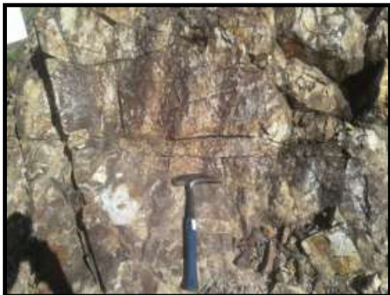
Gambar 3. Kenampakan Kekar (N140°E).

Struktur geologi Daerah Sulili meliputi jenis struktur geologi dan mekanisme pembentukannya. Berdasarkan jenisnya, struktur geologi yang dijumpai pada Daerah Sulili berupa struktur kekar. Kekar atau rekahan adalah jenis struktur batuan dalam bentuk bidang pecah (Haryanto, 2005). Kenampakan kekar ditunjukkan pada Gambar 3.