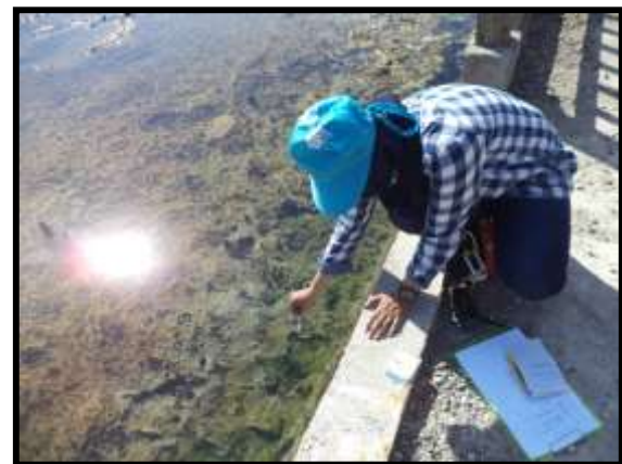
Gambar 2. Kegiatan pengukuran suhu air pada salah satu sumber mata air panas di Daerah Sulili (tampak mata air telah dibeton).