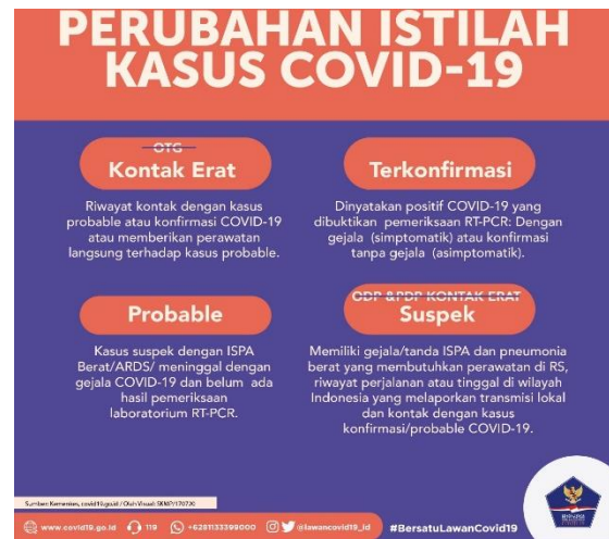
Gambar 1 Perubahan Istilah Kasus Covid 19