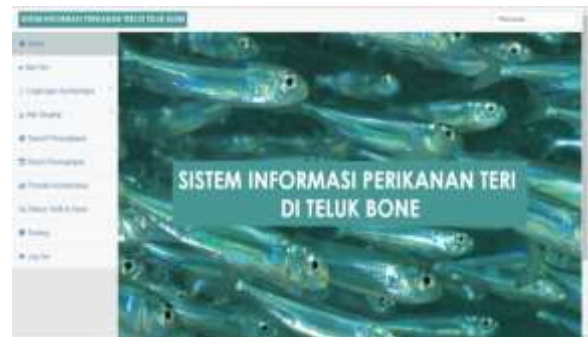
Gambar 1. Tampilan Awal Sistem Informasi Perikanan Teri di Teluk Bone.

Tampilan awal yang diberi judul Home ini merupakan antar muka yang menampilkan menu-menu yang terdapat pada Sistem Informasi Perikanan Teri di Teluk Bone (Gambar 1).