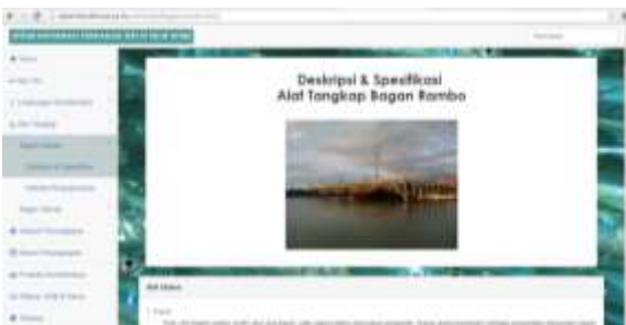
Gambar 7. Tampilan Sub Menu Deskripsi dan Spesifikasi Bagan Rambo