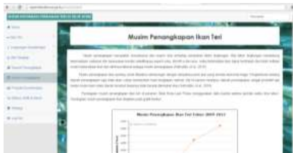
Gambar 12. Tampilan Menu Musim Penangkapan.

Menu ini berisi informasi musim penangkapan ikan teri berdasarkan hasil penelitian Gaffar (2015) yang membahas musim penangkapan ikan teri berdasarkan kuartal dari tahun 2009 hingga 2013 dan didapatkan hasilnya bahwa musim puncak penangkapan ikan Teri berada pada Kuartal IV (Gambar 12).