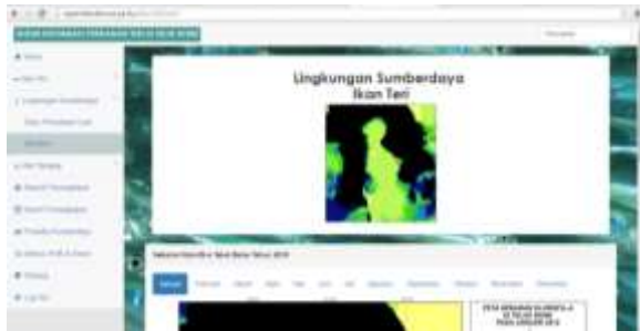
Gambar 6. Tampilan Sub Menu Klorofil-a