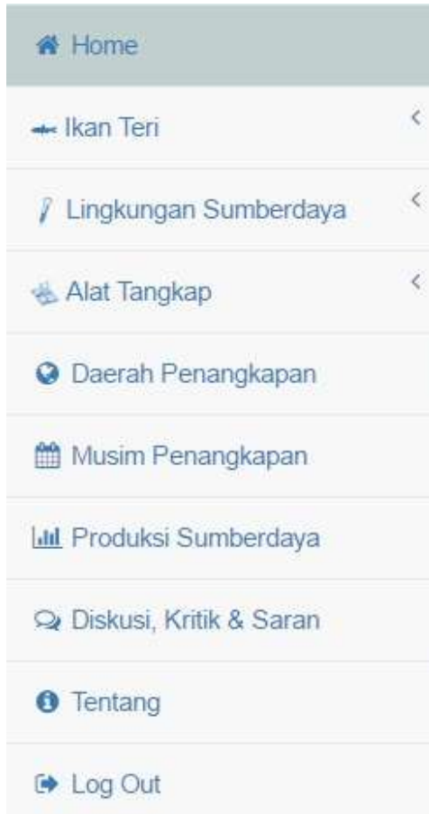
Gambar 2. Daftar Menu Sistem Informasi Perikanan Teri di Teluk Bone.