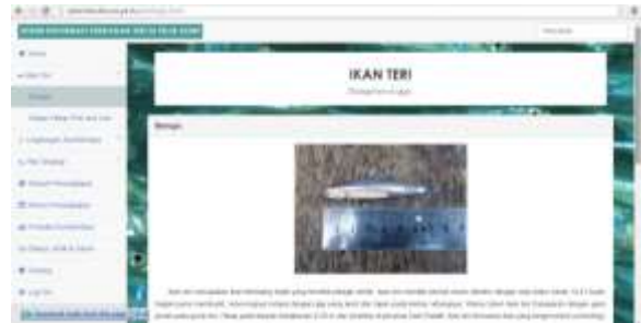
Gambar 3. Tampilan Sub Menu Biologis

Menu Ikan Teri terdiri dari dua halaman yaitu biologis dan umpan hidup pole and line . Halaman biologis berisi informasi mengenai ikan teri secara biologis (Gambar 3) dan halaman umpan hidup pole and line berisi tentang pemanfaatan sumberdaya ikan teri sebagai umpan hidup pole and line di Teluk Bone (Gambar 4).