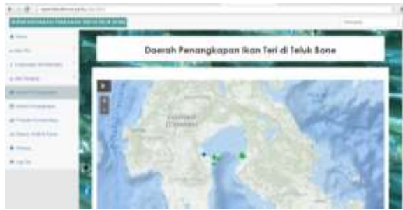
Gambar 11. Tampilan Menu Daerah Penangkapan Ikan.