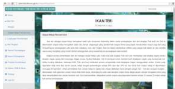
Gambar 4. Tampilan Sub Menu Umpan Hidup Pole and Line .