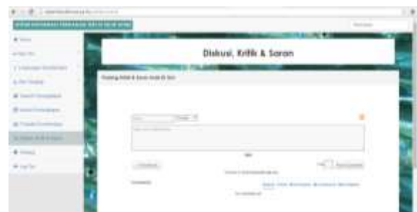
Gambar 14. Tampilan Menu Diskusi, Kritik dan Saran

Menu Diskusi, Kritik dan Saran berupa media komunikasi baik antar pengguna maupun pengelola dan pengguna. Melalui menu ini pengguna maupun pengelola dapat menerbitkan komentar, kritik maupun saran yang jika dilakukan dengan berbalas dapat berkembang menjadi suatu diskusi (Gambar 14).