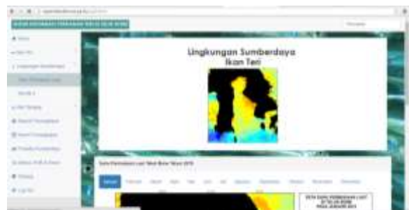
Gambar 5. Tampilan Sub Menu Suhu Permukaan Laut

Menu lingkungan sumberdaya terbagi atas dua menu yaitu suhu permukaan laut dan klorofil-a. Menu ini memberikan informasi mengenai suhu permukaan laut (Gambar 5) dan sebaran klorofil-a (Gambar 6) di perairan Teluk Bone selama tahun 2015.