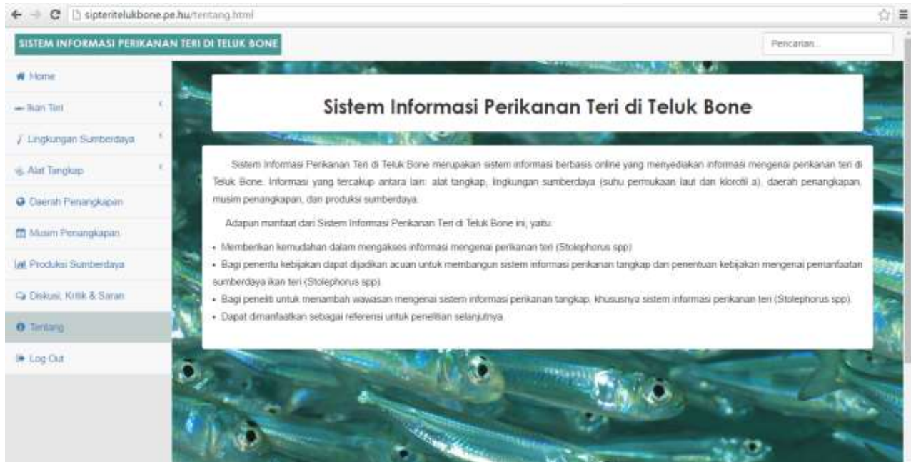
Gambar 15. Tampilan Menu

aspek informasi yang terdapat pada sistem informasi serta manfaat dari sistem informasi yang dibuat (Gambar 15).