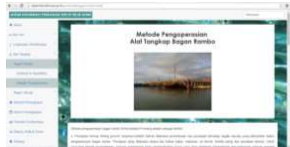
Gambar 8. Tampilan Sub Menu Metode Pengoperasian Bagan Rambo.