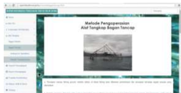
Gambar 10. Tampilan Sub Menu Metode Pengoperasian Bagan Tancap.