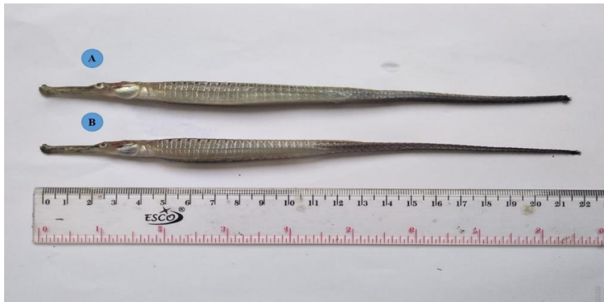
Gambar 2. Morfologi Dimorfisme Seksual D. boaja (Posisi Tampak Samping) (A = Ikan Betina, B = Ikan Jantan).

Perbedaan karakteristik morfologi untuk ikan jantan dan betina bisa terlihat dari perbedaan bentuk tubuh yang dapat dilihat pada Gambar 2 dan 3.