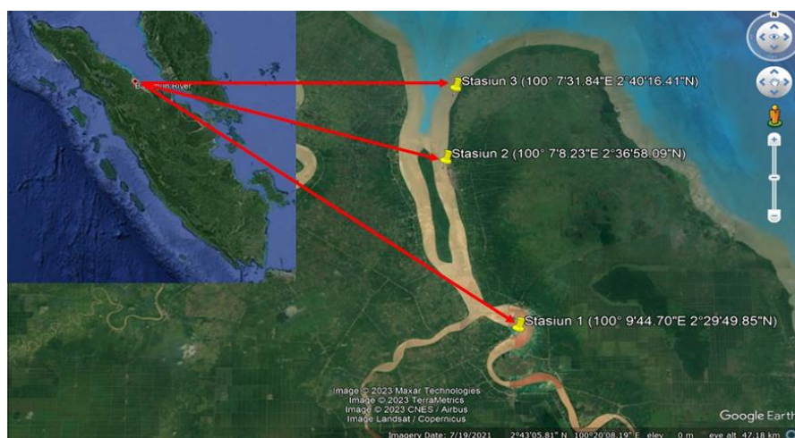
Gambar 1. Peta Lokasi Penelitian (Google Earth Pro).

Stasiun pengamatan yang ditetapkan berdasarkan metode purposive sampling merujuk pada penelitian yang dilakukan oleh Manullang & Khairul (2020). Pada penelitian ini ada 3 stasiun pengamatan yaitu stasiun 1 (100°9'44.70"BT2°29'49.85"LU), stasiun 2 (100°7'8.23"BT2°36'58.09"LU) Stasiun 3 (100°7'31.84"BT2°40'16.41"LU). Selanjutnya peta lokasi penelitian dapat dilihat pada Gambar 1.