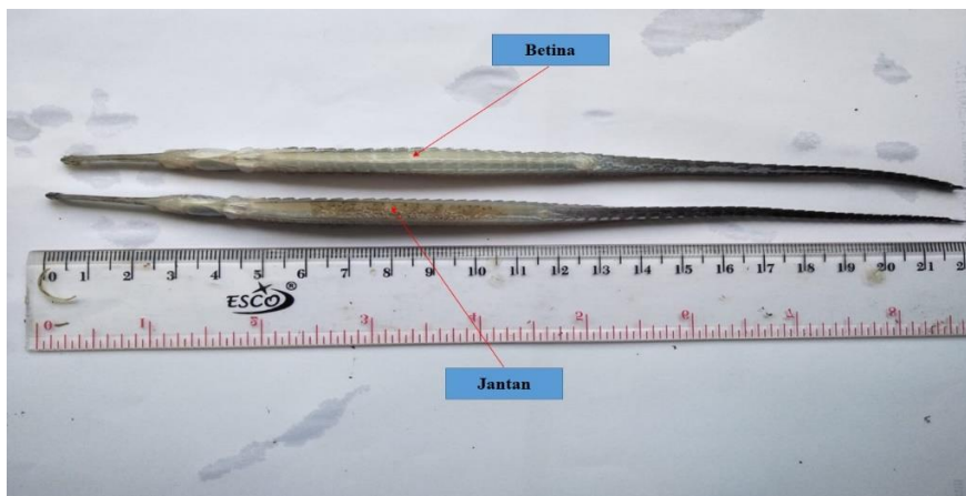
Gambar 3. Morfologi Dimorfisme Seksual D. boaja (Posisi Tampak Telentang).