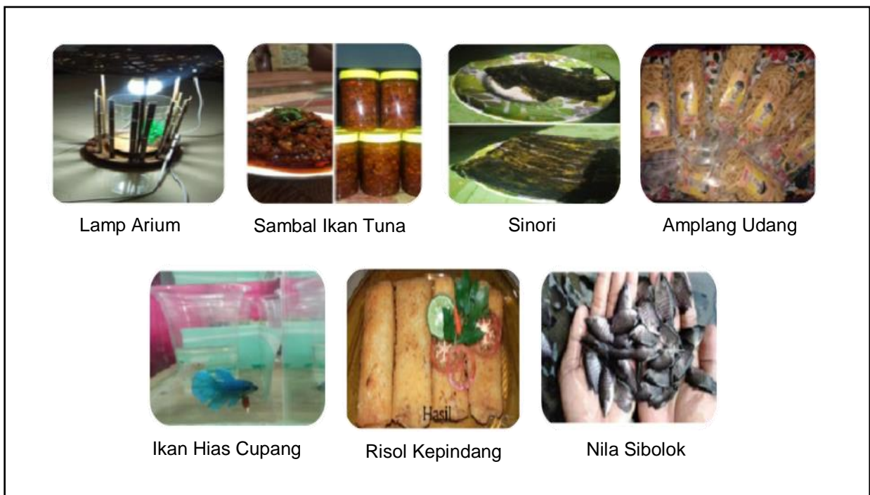
Gambar 1. Berbagai Jenis Produk Usaha Tenan.

Perkembangan usaha tenan berjalan dengan berbagai kondisi usaha. Kegiatan dalam proses usaha yang telah dilakukan oleh tenan dijalankan mulai dari hulu hingga hilir. Jenis produk usaha juga beragam, yaitu sambal ikan tuna, puding rutla, lamp arium, sinori, salad buah, martabak ikan, risol kepindang, ikan hias cupang, dan nila sibolok (Gambar 1).