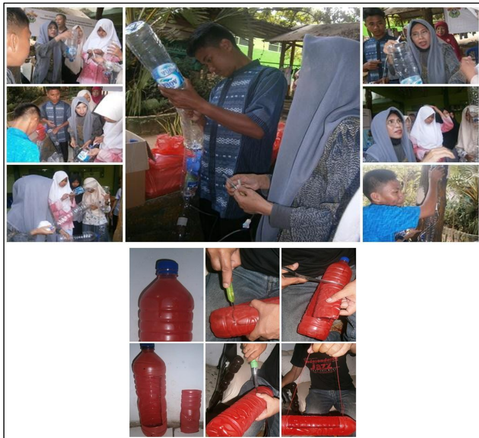
Gambar 6. Pembuatan Instalasi vertikultur.

artistik (Gambar 6). Memanfaatkan botol plastik bekas merupakan suatu dukungan terhadap program pemerintah untuk memanfaatkan barang bekas sehingga limbah yang mencemari lingkungan semakin berkurang.