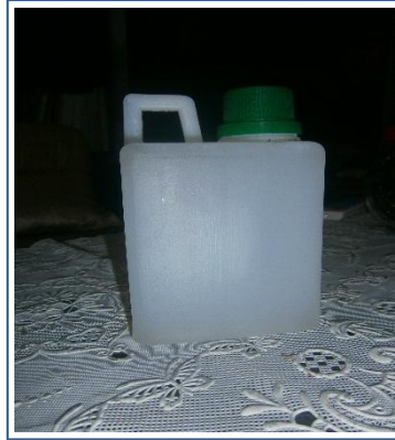
Gambar 5. Produk ZPT dan POC dari limbah air kelapa dalam kemasan.