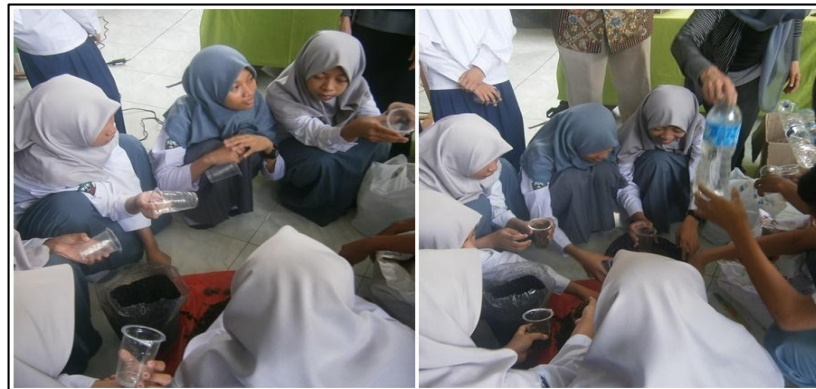
Gambar 2. Pengisian media semai

Gambar 2 memperlihatkan santriwati sedang mengisi wadah penyemaian berupa gelas-gelas plastik bekas air minum. Penggunaan gelas-gelas plastik memudahkan saat pemindahan tanaman ke wadah vertikultur dan memanfaatkan limbah. Saat pemindahan, wadah disobek menggunakan cutter tanpa harus membongkar media tanam sehingga akar tanaman tidak rusak.