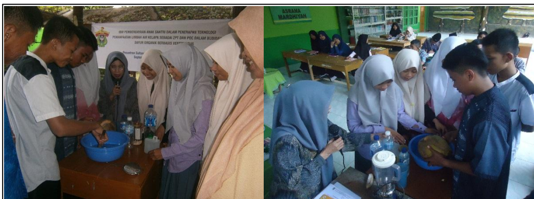
Gambar 4. Pembuatan ZPT dan POC

limbah air kelapa. ZPT dan POC dari limbah air kelapa yang telah dibuat selanjutnya disimpan dalam jerigen kecil yang tertutup rapat dan terhindar dari cahaya dan suhu yang panas (Gambar 5).