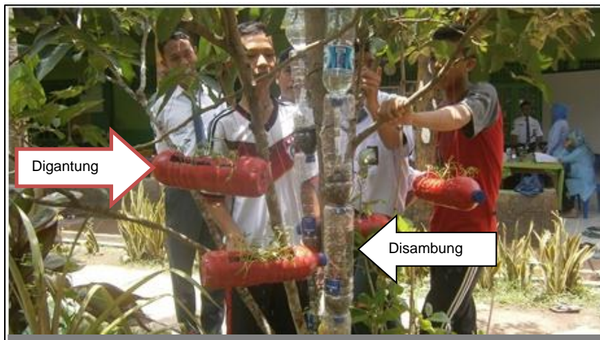
Gambar 7. Pemasangan instalasi dan penanaman sayuran dengan sistem vertikultur.

menyambung satu botol dengan botol lainnya sehingga hanya menggunakan areal yang kecil. Model lainnya adalah dengan cara instalasi vertikultur digantung di cabang pohon bagian bawah yang kurang daunnya agar sayuran mudah mendapatkan sinar matahari yang berbed,a atau diatur menurut ketinggian cabang pohon. Instalasi vertikultur yang digantung di pohon-pohon akan lebih menyemarakkan dan memperindah pekarangan pesantren Sultan Hasanuddin (Gambar 7).