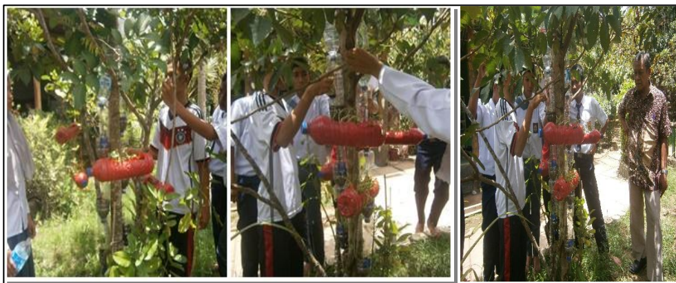
Gambar 8. Pemeliharaan tanaman sayuran vertikultur.