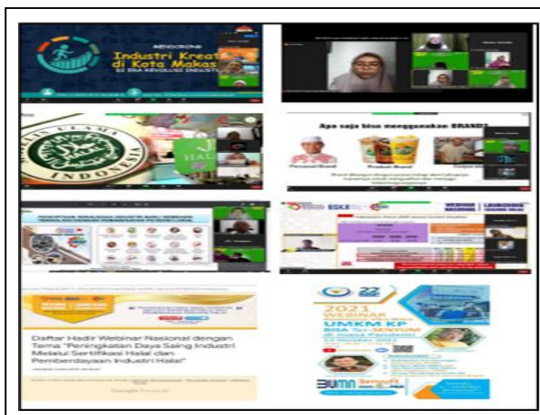
Gambar 4. Webinar Kewirausahaan yang diikuti oleh peserta PPK.