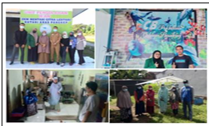
Gambar 3. Kunjungan peserta Program PPK ke Industri

Rencana kegiatan selanjutnya yaitu melakukan pendampingan masing-masing usaha. Dengan harapan setiap usaha sudah melakukan penjualan melalui market place , media sosial (Gambar 4) mengingat kondisi sekarang ini masih dalam suasana pandemi serta melakukan evaluasi dan monitoring terkait dengan kemajuan setiap jenis usaha serta memperluas jaringan khususnya bagian pemasaran.