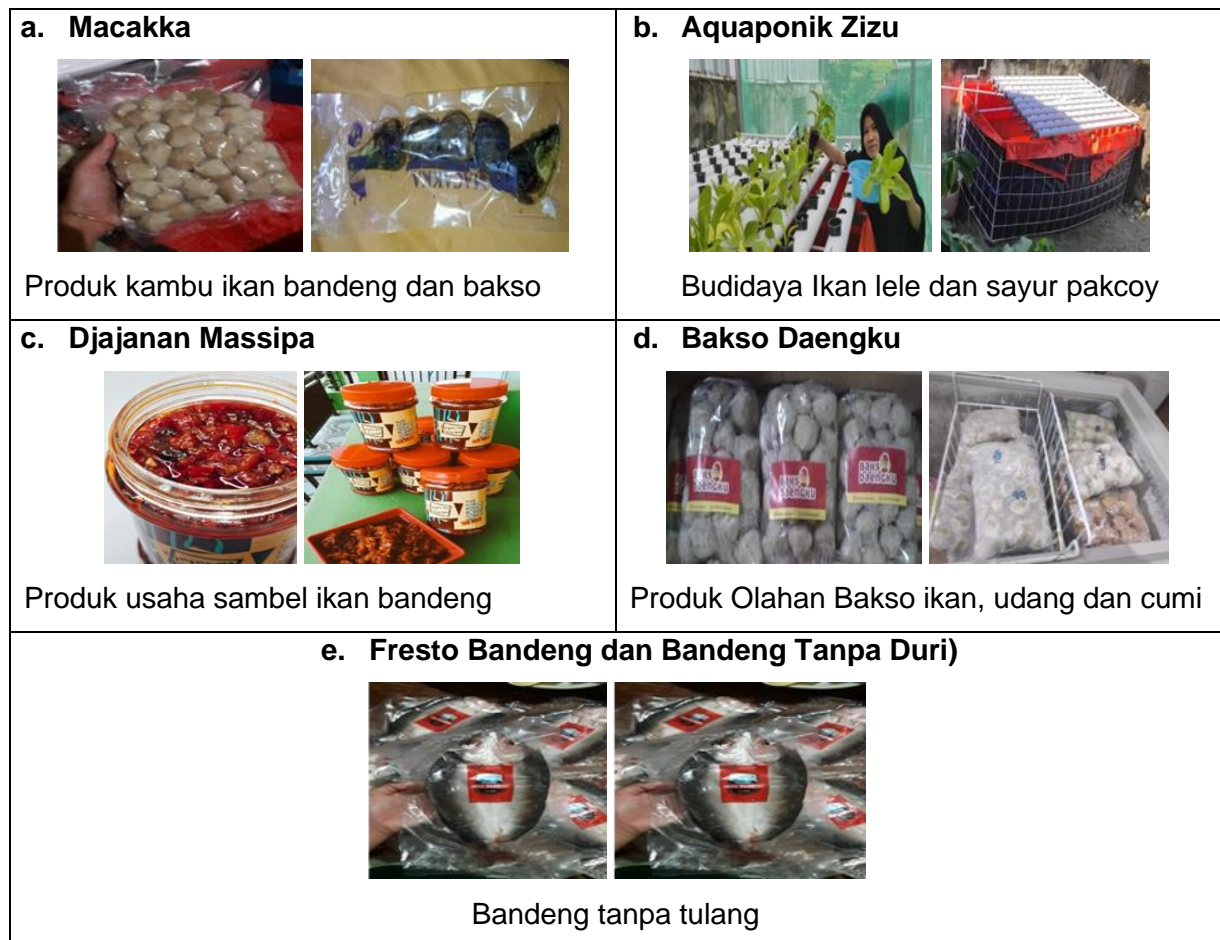
Tabel 1. Bidang Usaha dan produk Program Pengembangan Kewirausahaan (PPK) Tahu ke-III Fakultas Perikanan dan Ilmu Kelautan Universitas Muslim Indonesia.