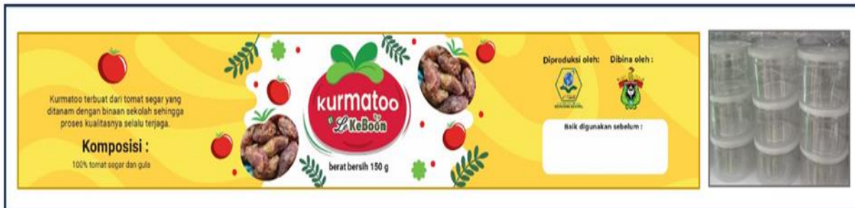
Gambar 2. Label dan Kemasan Kurma Tomat.

komposisi, massa produk, merek dan informasi lainnya. Merek yang digunakan untuk produk olahan kurma tomat yaitu KURMATOO LeKeBoon.