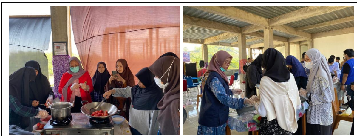
Gambar 3. Pelatihan Pengolahan Produk Kurmato.

produksi dan hal-hal yang harus diperhatikan untuk setiap tahap pengolahan kurma tomat. Selain itu, disampaikan pula potensi tomat menjadi berbagai produk olahan yang bergizi dan menguntungkan. Materi yang diberikan kepada siswa diharapkan dapat meningkatkan pengetahuan awal peserta. Pemberian materi dilakukan oleh instruktur yang ahli di bidang tersebut (Gambar 3).