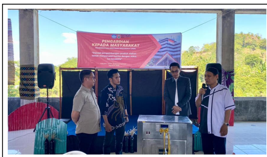
Gambar 4. Serah Terima Peralatan Pengolahan Tomat menjadi produk Kurmato.

Kegiatan pengabdian yang telah dilakukan menghasilkan produk kurma tomat dengan kemasan menarik dan siap untuk dipasarkan. Produk ini secara keseluruhan dihasilkan oleh peserta dengan arahan dari pendamping. Partisipasi peserta dalam seluruh tahapan produksi kurma tomat, mulai dari pembuatan hingga pengemasan merupakan bentuk nyata pemahaman peserta dan penghargaan terhadap kegiatan yang dilakukan. Untuk mendukung keberlanjutan kegiatan pengabdian dilakukan pemberian peralatan penunjang produksi agar mitra dapat secara mandiri mengembangkan produk kurmato (Gambar 4). Keberhasilan kegiatan ini juga dapat dilihat dari keberlanjutan tahapan kegiatan dengan mengikutsertakan produk yang telah diproduksi pada suatu pameran. Produk yang dihasilkan juga dapat dipasarkan melalui kerjasama dengan koperasi atau unit penjualan lainnya.