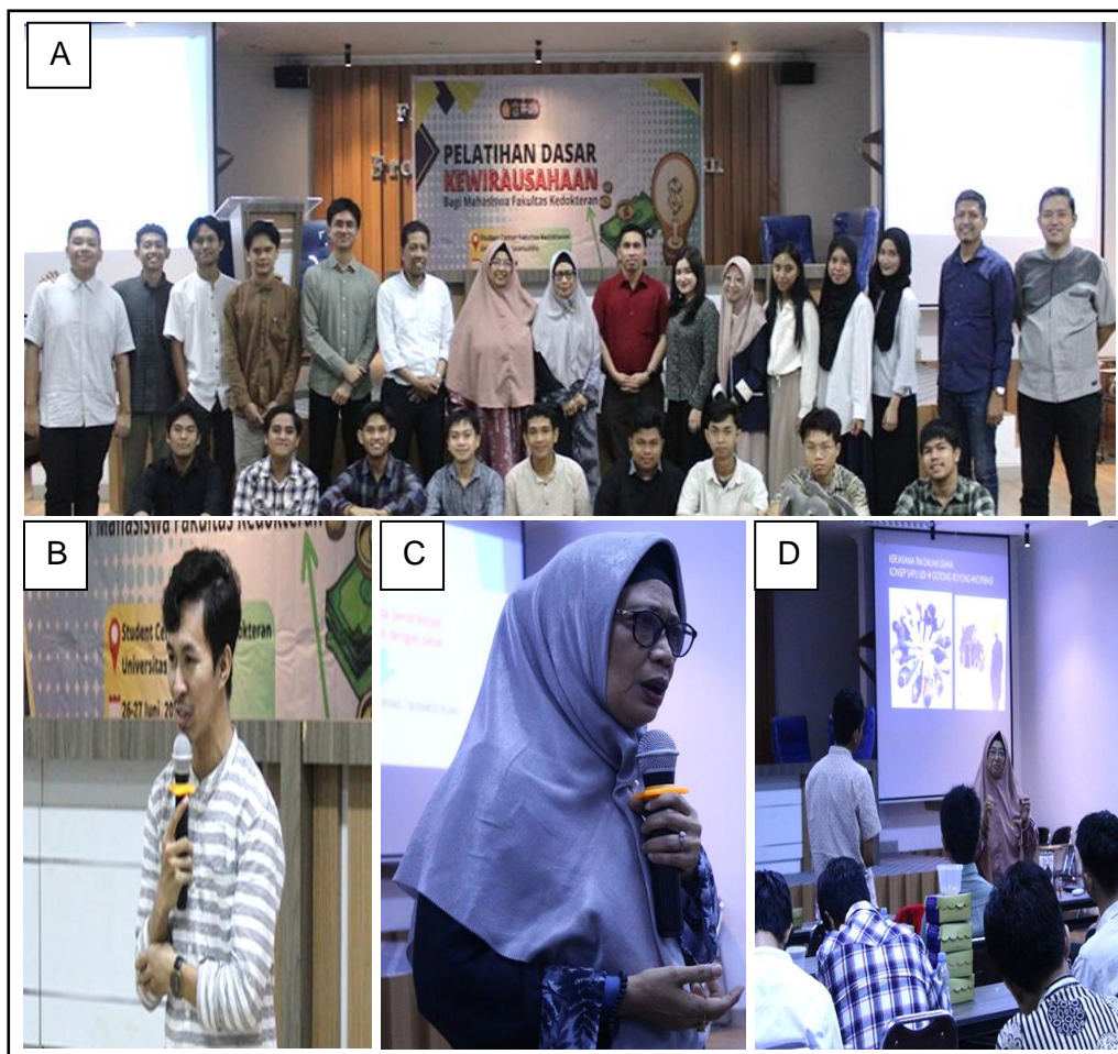
Gambar 1. A) Foto bersama seluruh Peserta pelatihan, B) Pemateri dari Mitra, C) Pemateri dari Unhas, dan D) Peserta asyik mengikuti materi.

Pada Kegiatan ini mahasiswa dan dosen pembimbing sangat antusias mengikuti acara tersebut karena dipandu dengan sangat dinamis dengan metode diskusi dua arah yang terbuka dan aktif tapi santun. Hal ini dapat dilihat dari foto-foto pelaksanaan pelatihan tersebut (Gambar 1).