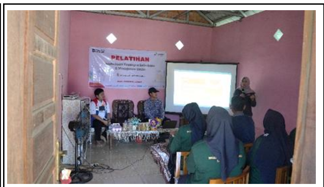
Gambar 9. Pelatihan Pembukuan Keuangan Sederhana dan Manajemen Usaha.