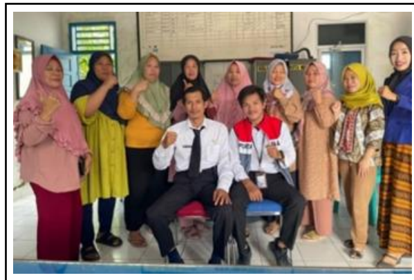
Gambar 4. Focus Group Discussion (FGD) PT. Pertamina Patra Niaga Fuel Terminal Lahat.

Lingkungan Hidup Kabupaten Lahat, Dinas Kesehatan Kabupaten Lahat, Pemerintah Kelurahan Kota Negara. Kemitraan dan kolaborasi juga dilakukan dengan organisasi nonpemerintah, akademisi, dan sektor swasta untuk mendukung pelaksanaan program Kelurahan Kota Negara Berseri. Dokumentasi kegiatan FGD yang melibatkan pemangku kepentingan tersebut ditunjukkan pada Gambar 4.