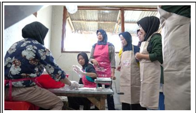
Gambar 11. Pelatihan Pengemasan Produk.