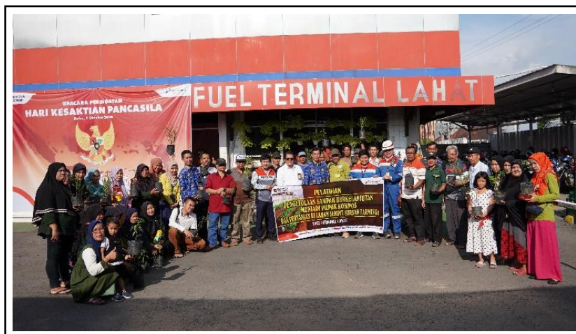
Gambar 7. Pelatihan Pupuk Kompos dan Pertanian di Lahat Sempit (Urban farming)

Melalui pelatihan ini, masyarakat tereduksi cara mengolah sampah rumah tangga secara berkelanjutan untuk dijadikan pupuk kompos dan lahan pekarangan yang sebelumnya kurang termanfaatkan dapat berubah menjadi media pertanian produktif melalui penerapan urban farming, sehingga mampu menghasilkan tanaman hortikultura yang bermanfaat bagi kebutuhan rumah tangga. Pengelolaan sampah dan pemanfaatan pekarangan ini tidak hanya mendukung ketahanan