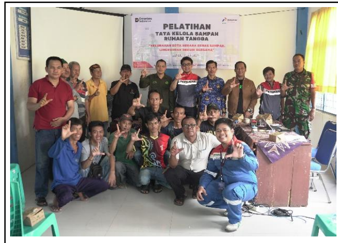
Gambar 6. Pelatihan Pengelolaan Sampah Rumah Tangga.