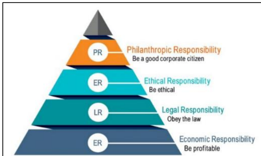
Gambar 1. Piramida Corporate Social Responsibility (CSR)

piramida CSR yang terdiri atas empat bagian yakni economic responsibility , legal responsibility , ethical responsibility , dan philanthropic responsibility . Model piramida CSR tersebut dapat dilihat pada Gambar 1.