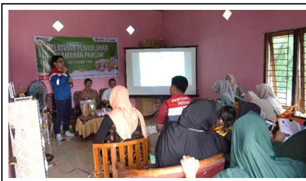
Gambar 8. Pelatihan Keamanan Pangan.

sebut diharapkan mampu meningkatkan profesionalisme pengelolaan usaha, kualitas produk, dan daya saing kelompok binaan, sehingga kelompok mandiri. Dokumentasi kegiatan pelatihan peningkatan kapasitas kelompok binaan tersebut ditunjukkan pada Gambar 8, Gambar 9, Gambar 10 dan Gambar 11.