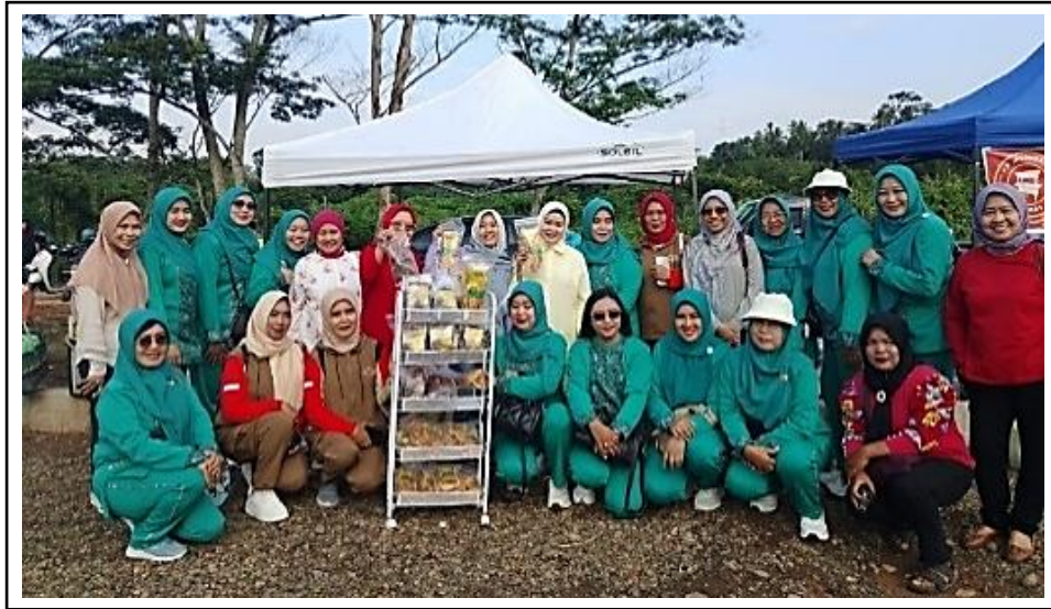
Gambar 12. Pameran produk bersama Ketua PKK Kabupaten Lahat.

Dokumentasi kegiatan pameran produk bersama Ketua PKK Kabupaten Lahat ditunjukkan pada Gambar 12.