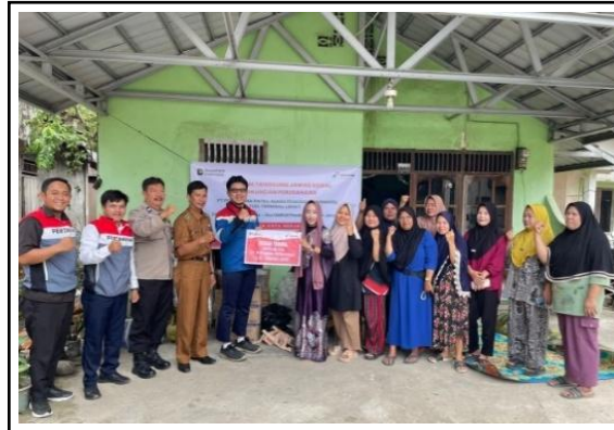
Gambar 5. Dukungan Fasilitas Sarana dan Prasarana oleh PT. Pertamina Patra Niaga Fuel Terminal Lahat kepada Kelompok Binaan.

Selanjutnya, PT. Pertamina Patra Niaga Fuel Terminal Lahat juga memfasilitasi peningkatan pengetahuan masyarakat melalui pelatihan-pelatihan. Pada tahun 2025 setidaknya PT. Pertamina Patra Niaga Fuel Terminal Lahat telah memfasilitasi 5 pelatihan kepada masyarakat kelurahan Kota Negara yang meliputi: