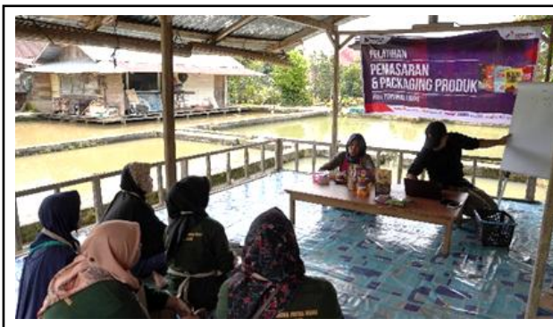
Gambar 10. Pelatihan Pemasaran.