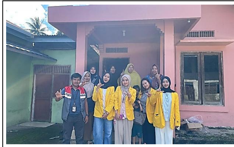
Gambar 13. Monitoring dengan mahasiswa Universitas Sriwijaya.

kungan, yang mencerminkan keberhasilan pendekatan pemberdayaan berbasis partisipasi.