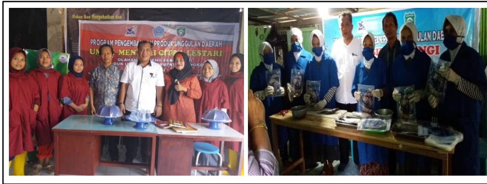
Gambar 1. Pelatihan Rantai dingin dan Sanitasi Hygiene di UKM Mentari Citra Lestari dan TIM PPUD.