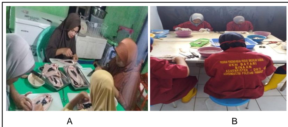
Gambar 3. Pencabutan Duri Ikan Bandeng dengan Metode Sanitasi Pekerja A. Sebelum Pelatihan Sanitasi; B. Sesudah Pelatihan Sanitasi