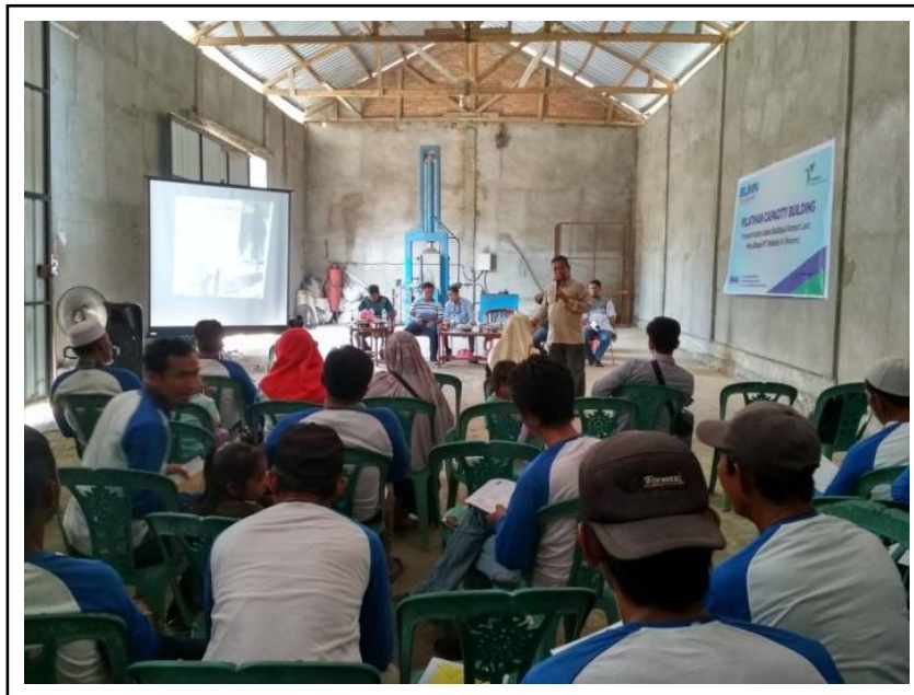
Gambar 1. Suasana penyuluhan.

Palopo, memiliki sifat tanah sulfat masam (DKP Sul-Sel, 2008) dan kadar fosfat di perairan sangat rendah (Patahiruddin, 2015). Dengan kondisi tersebut, maka metode dan teknik budidaya G. verrucosa di Kota Palopo agak berbeda dengan daerah lain jika budidaya G. verrucosa ingin berhasil.