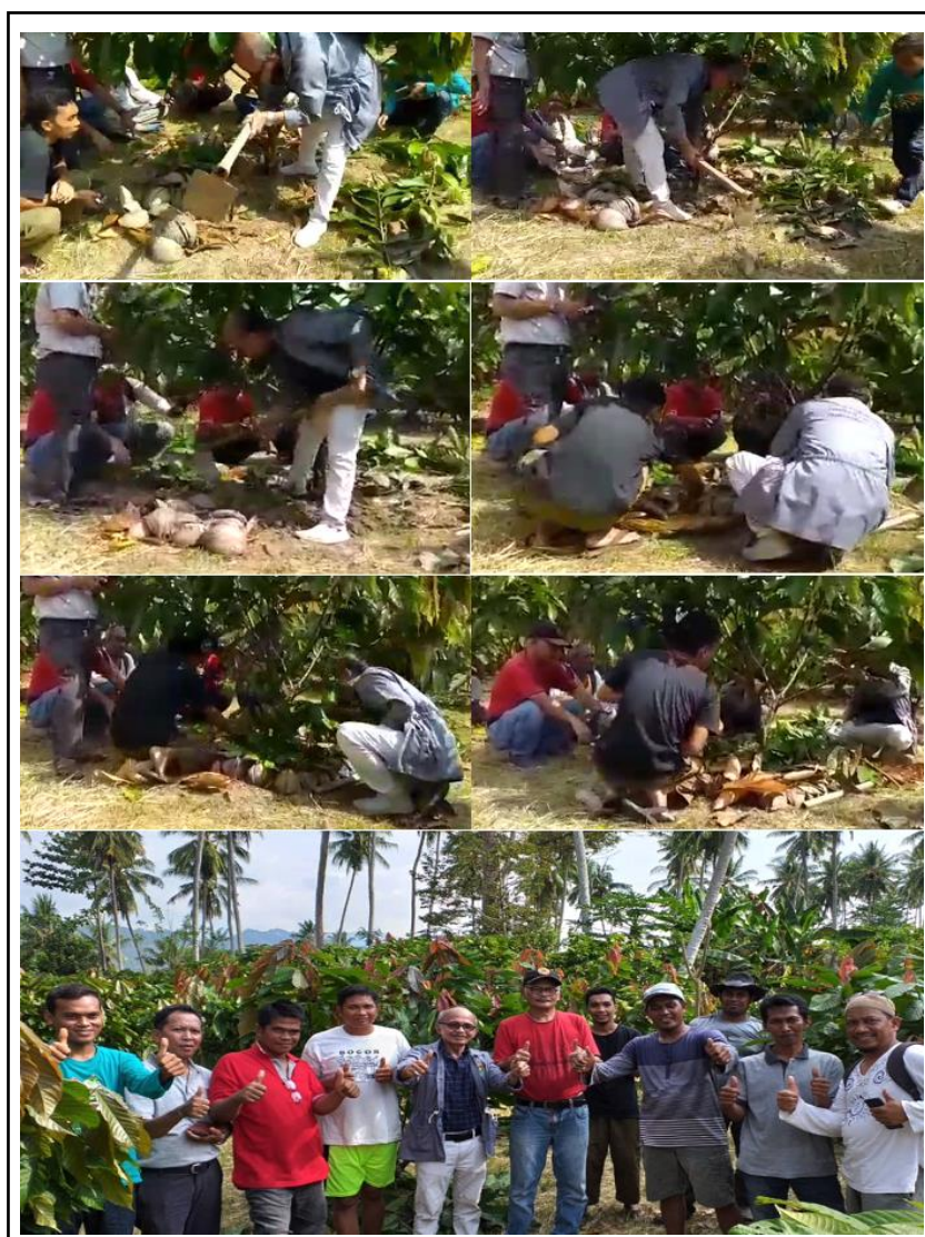
Gambar 8. Demonstrasi Pembuatan Piringan tanaman di Batunong dan Akhir kegiatan Pemangkasan di Kodeoha.