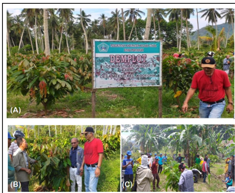
Gambar 4. Kondisi tanaman muda (1 – 2 tahun) yang belum pernah dilakukan pemangkasan. Demplot kakao di Kodeoha (A), Tanaman Kakao rakyat di Batunong (B) dan Pasir Putih (C).

Pemangkasan tanaman kakao pada dasarnya dibedakan berdasarkan tujuan pemangkasan dan berat ringannya pemangkasan. Berdasarkan tujuan pemangkasan dibedakan atas tiga jenis pemangkasan yaitu: (1) Pemangkasan bentuk; (2) Pemangkasan pemeliharaan; dan (3) Pemangkasan produksi. Berdasarkan berat ringannya pemangkasan dibedakan atas: (1) Pemangkasan berat; dan (2) Pemangkasan ringan. Pemangkasan bentuk, pemangkasan produksi, dan pemangkasan untuk mengurangi ketinggian tanaman atau pemangkasan setelah dilakukan sambung samping tergolong pemangkasan berat, sedang pemangkasan pemeliharaan tanaman termasuk pemangkasan ringan.