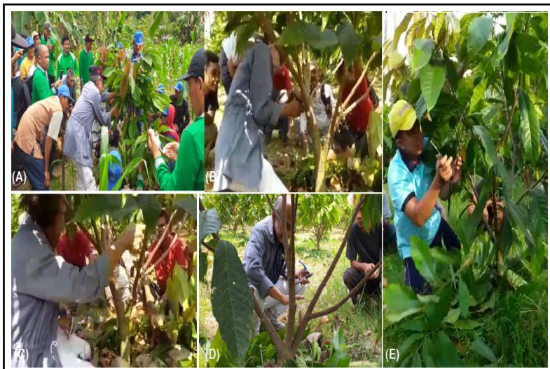
Gambar 7. Demonstrasi Pemangkasan yang dilakukan pada lokasi Penyuluhan di Pasir putih(A), Batunong (B,C,D) dan Kodeoha (E).