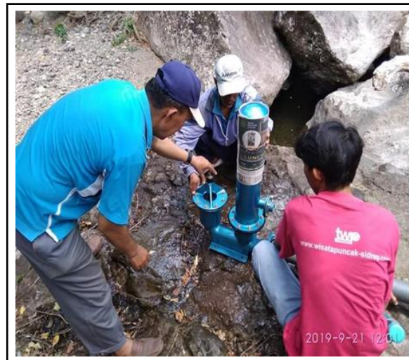
Gambar 4. Petunjuk teknis pemasangan pompa hydran.

Akibat air mengalir di katup mengalir kembali maka tekanan pada tutup berkurang dan karena kekuatan dorongan pegas sehingga katup bergerak turun dan membuka. Setelah terbentuk water hammer serta katup buang terbuka, air akan kembali mengalir ke katup buang. Ketika terjadi gerakan menutup, check valve berperan pada tambahan tekanan air yang mengalir ke arah katup buang (Gambar 5).