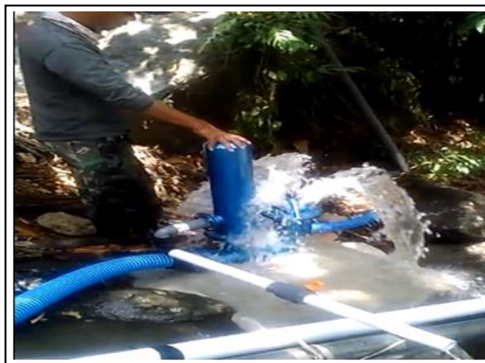
Gambar 5. Pompa hydran sedang beroperasi.