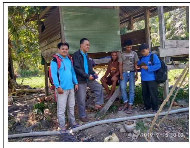
Gambar 3. Sosialisasi teknologi dan pemasangan pompa hydram.

Setelah survey dilaksanakan dengan melihat ketinggian lokasi di daerah tersebut, dilakukan uji coba di lokasi kegiatan Pengabdian Masyarakat di Desa Nepo Kabupaten Barru sebelum pemasangan di lapangan. Hasil uji coba pompa hydram dapat mengalirkan air sampai dengan ketinggian kurang lebih 10 meter. Hal ini sudah melebihi hasil survey dengan ketinggian 7 meter. Setelah observasi lapangan dan diperoleh data tentang kondisi lapangan dan lingkungan pelaksanaan kegiatan pengabdian masyarakat (Gambar 3).