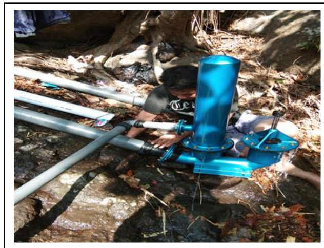
Gambar 2. Tipe pompa hydram.

Survei dan rancangan pemasangan pompa hydram di lokasi pengabdian. Air adalah salah satu dari sekian banyak sumber daya alam yang sangat dibutuhkan bagi kehidupan makhluk hidup, serta membantu aktivitas kehidupan manusia terutama di bidang pertanian yakni pengelolaan persawahan. Pompa hydram yang digunakan pada kegiatan pengabdian di Desa Nepo adalah pompa hydram buatan Bapak Susilo dari Jawa Tengah, sumber referensi ini berasal dari peneliti yang sudah pernah menggunakan produk beliau (Gambar 2).