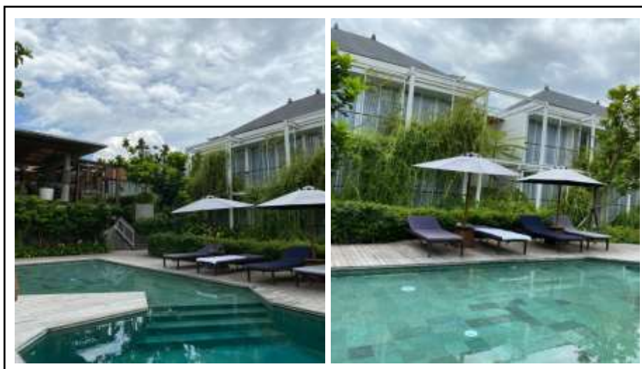
Gambar 3. Kolam Renang di Hotel Rimbun Cangu.

Selain itu kawasan penataan bangunan yang berada di sekitaran kolam renang juga mendukung pelaksanaan kegiatan menginap dan berkunjung bagi wisatawan sehingga wisatawan dapat menikmati kunjungannya sembari mengunggahnya di media sosial (Gambar 4).