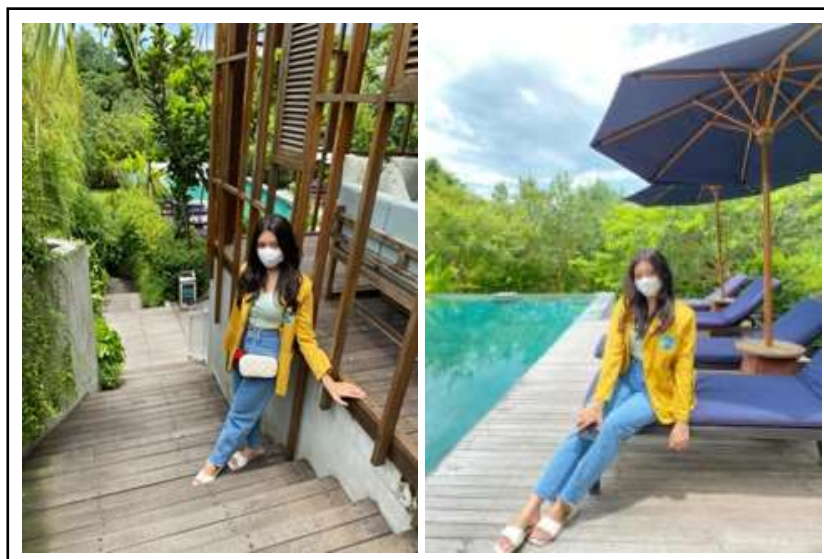
Gambar 1. Hasil Observasi di Hotel Rimbun Cangu.

Dari Hasil Observasi ditemukan bahwa Hotel Rimbun Cangu memiliki lokasi yang instagrammable, dan cocok untuk trend anak muda jaman sekarang sebagaimana diperlihatkan pada Gambar 1.