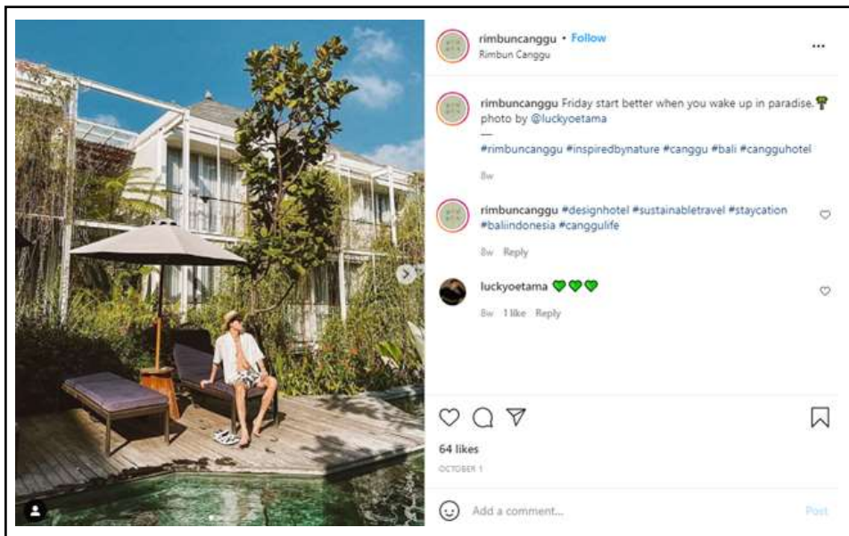
Gambar 7. Tampilan Hotel Rimbun Cangu pada Unggahan Media Sosial di Instagram.

wisatawan dapat menikmati liburan jangka pendek dengan biaya yang terjangkau sehingga melalui staycation yang dilaksanakan, durasi kunjungan wisatawan ke Hotel Rimbun Cangu tetap terlaksana meskipun pendek dan meningkatkan penjualan maupun promosi melalui wisatawan tersebut.