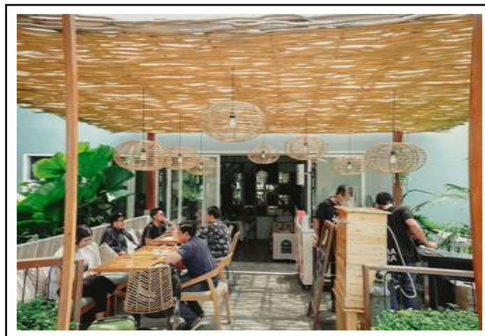
Gambar 5. Restaurant di Hotel Rimbun Canggü.

Restaurant yang dimiliki dengan interior yang modern dan harga yang terjangkau, selain itu promosi dilaksanakan guna menambah minat wisatawan maupun masyarakat lokal untuk berkunjung dan menikmati makanan dan minuman yang disediakan, hal ini pun akan berpengaruh pada perhatian wisatawan kepada lokasi Hotel Rimbun Canggü sebagai suatu akomodasi yang memiliki fasilitas nyaman dan menarik untuk dijadikan tempat menginap bersama pasangan atau keluarga.