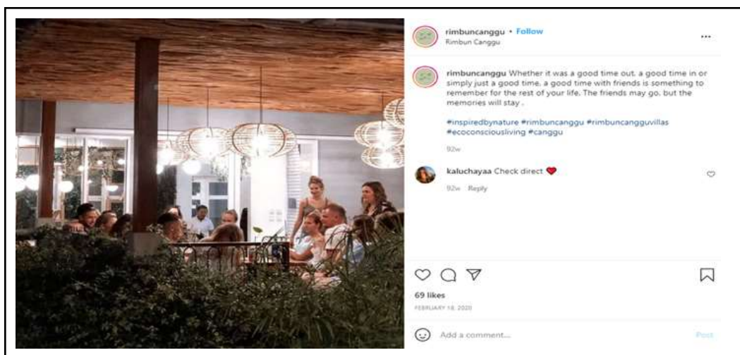
Gambar 6. Unggahan Restoran di Hotel Rimbun Canggü pada media sosial Instagram.